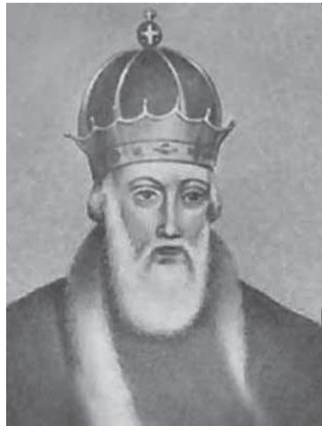
Святой равноапостольный князь Владимир

Вскоре в Киеве возникла Киево-Печерская лавра. Отсюда пошло по Руси монашество. Великую помощь приносили истинные иноки русской земле своими молитвами, а некоторые из них принимали и прямое участие в государственных делах.