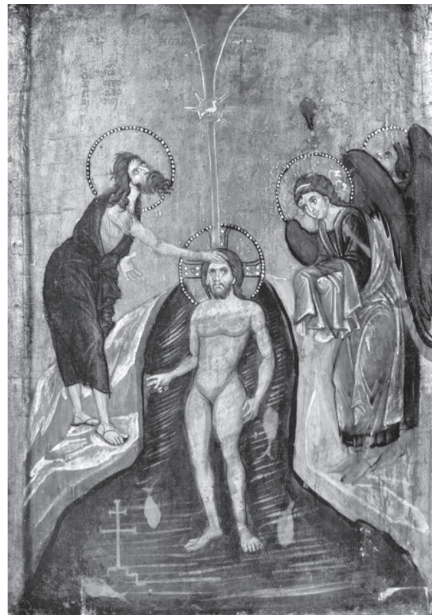
Икона второй половины XIII века, Синайский монастырь

Третье: крещение Самого Иисуса, погружение Его в иорданскую воду рукою Иоанна. Ведь если Он – Спаситель, то зачем Ему крещение, этот символ раскаяния и жажды очищения? И, однако, на сомнения Иоанна Иисус отвечает твердым требованием крещения, и Иоанн крестит Его. И вот Церковь веками как