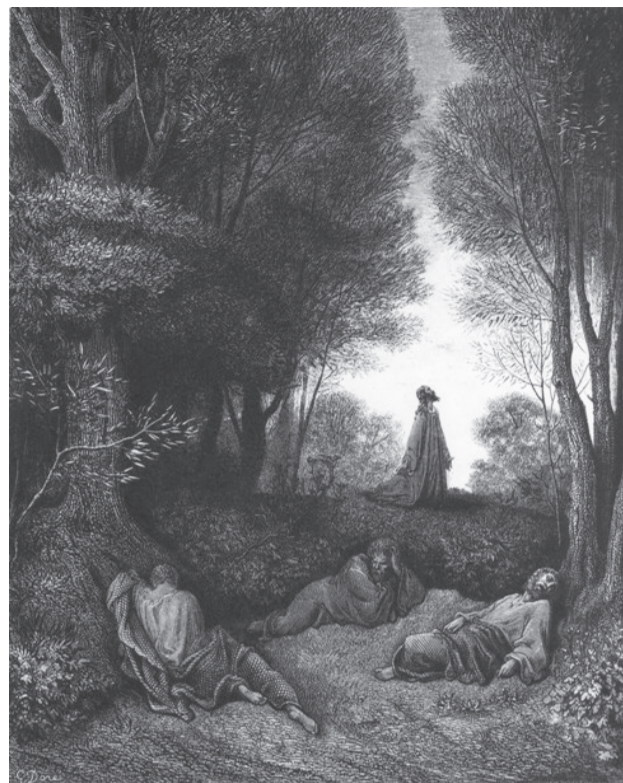
Гюстав Доре. Иисус молится в Гефсиманском саду