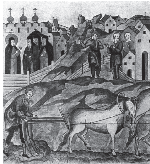
Работа на пахине перед Троице-Сергиевым монастырем. Миниатюра. XVI в.

Нынешние молодые люди похожи на новые машины, в двигателях которых от холода загустело масло. Для того чтобы эти машины завелись, масло должно разогреться – иначе ничего не получится. Несчастливые юноши! Они приходят ко мне в каливу – не один и не два, а множество – и спрашивают: «Что мне делать, отец? Чем мне заполнить свое время? На меня наваливается тоска». – «Брат ты мой, да найди ты какую-нибудь работу», – говорю я, а в ответ слышу: «Дело не в этом. Деньги у меня есть. Зачем она мне нужна, эта работа?» – «Но апостол Павел, – говорю я снова, – пишет: если кто не хочет трудиться, тот и не ешь (2 Сол. 3, 10). Даже если у тебя нет проблем