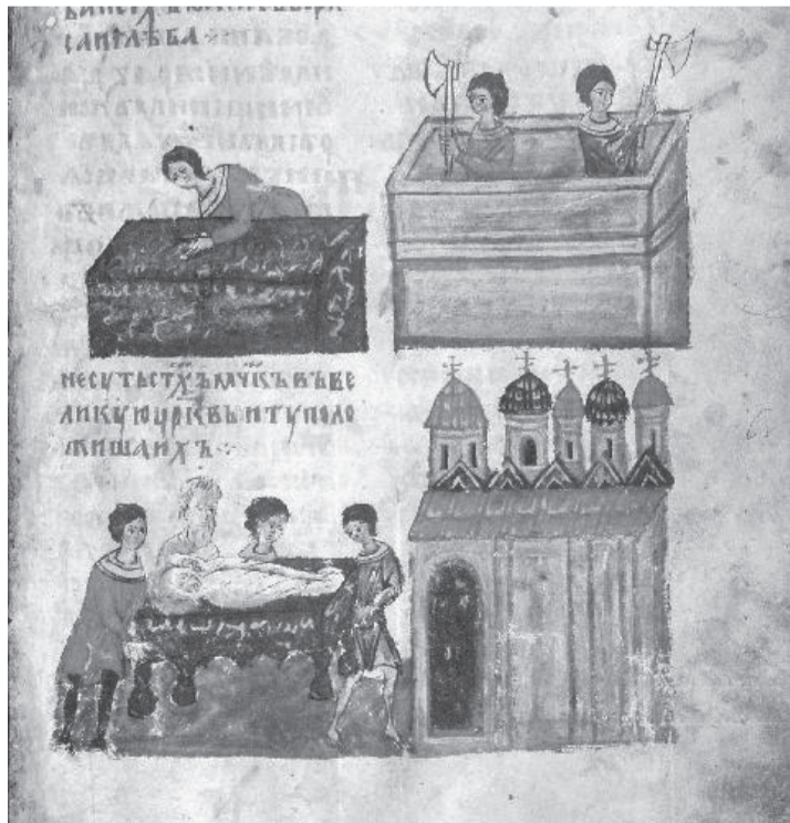
Строительство Борисоглебского храма в Вышгороде и перенесение в 1115 году мощей братьев в новый храм