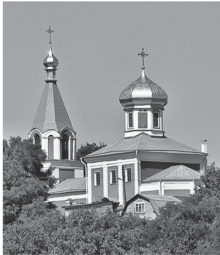
Борисоглебская церковь в Вышгороде. Украина

Незадолго до кончины великий князь Ярослав Мудрый разделил Киевское княжество между четырьмя сыновьями. Киевский престол отошел боголюбивому князю Изяславу. Вскоре он был изгнан из столицы взбунтовавшимися горожанами. Однако по заступничеству святых благоверных князей Бориса и Глеба ему удалось вернуться на Киевское княжение. В благодарность за это князь Изяслав решил построить новый храм во имя святых страстотерпцев вместо обветшавшего Борисоглебского собора и перенести их честные мощи. Он выделил на постройку большие средства из великокняжеской казны. Когда строительство завершилось, князь Изяслав пригласил на освящение храма своих братьев – Всеволода и Святослава и Митрополита Киевского Георгия, а также несколько епископов. Это событие произошло 2 мая 1072 года.