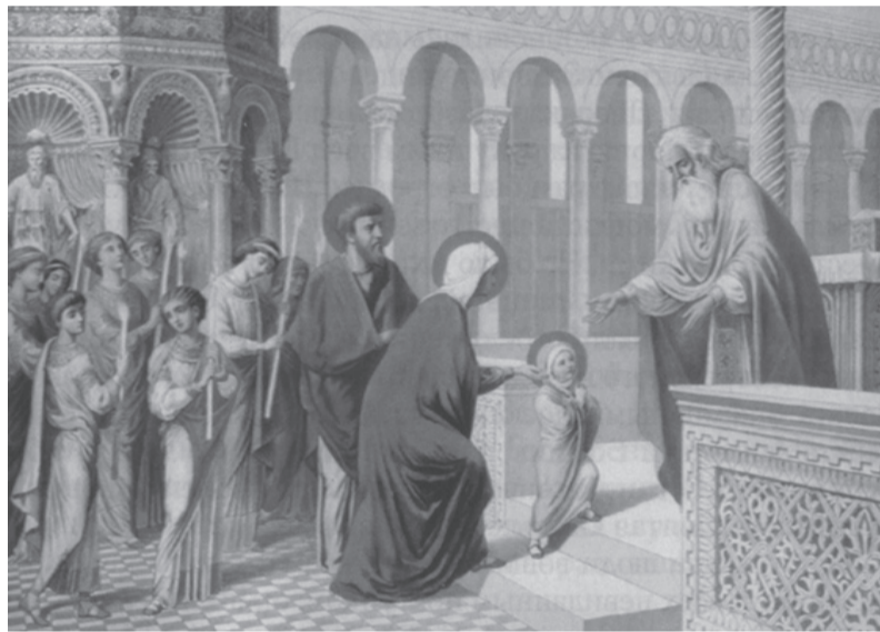
Введение во храм Пресвятой Богородицы. Акварель князя Г.Г. Гагарина (1810 – 1893)

Если высокому назначению Девы Марии должна соответствовать неприступная для самой тени порока святость воспитания будущей Матери Божией, то надлежит нам вспомнить, сколь так же высоко назначение вообще детей Церкви, и сколь благородны, чисты, божественны должны быть правила воспитания христианского. Отцы и матери, внимающие слову сему! Святой пророк и Царь Давид о себе говорит, что он зачат в беззаконии, и во грехах родила его мать его. Эту же самую истину, относительно ко всем нам, подтверждает изречение Самого Спасителя, в известной ночной беседе Его с Никодимом о возрождении: рожденное от плоти плоть есть. Правда, благочестивые, трезвые, целомудренные, строгие в хранении чистоты ложа, истину и добродетель любящие и молитвою дышащие родители менее греховного наследия передают чадам своим, нежели предающиеся пьянству, и безчинными желаниями удовольствий чувственных превращающие порядок Божий, и средства поставляющие на месте цели, сварливые, страха Божия не имеющие, и разными пороками осрамляющие жизнь свою, и повреждающие не только воображение, но и кровь свою. Однако во всяких случаях сие слово Иисуса Христа есть слово истины: рожденное от плоти плоть есть; и если кто не родится от воды и Духа, то не может войти в Царствие Божие.