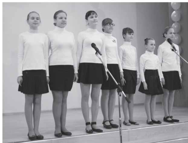
Выступление ансамбля «Армонико»

об этих выступлениях можно будет прочитать в следующих выпусках нашей газеты.