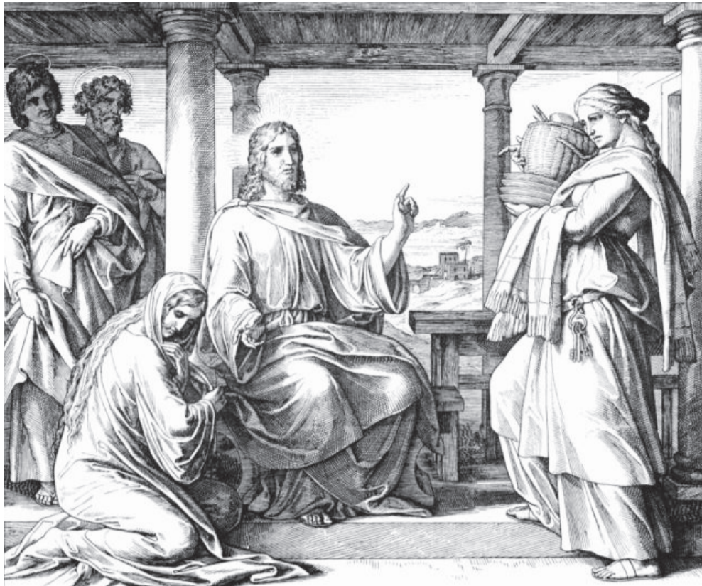
Иисус Христос в доме Марфы. Иллюстрации к Библии. Юлиус Шнорр фон Карольсфельд (1794 – 1872).

27 Когда же Он говорил это, одна женщина, возвысив голос из народа, сказала Ему: блаженно чрево, носившее Тебя, и сосцы, Тебя питавшие! 28 А Он сказал: блаженны слышащие слово Божие и соблюдающие его.