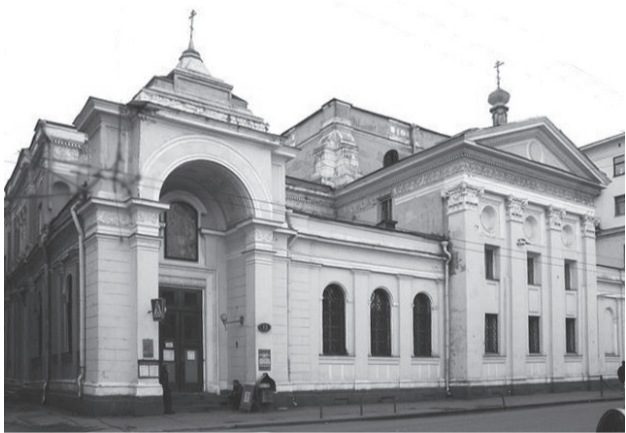
Храм Троицы Живоначальной, что «на Грязех»

В сказании об иконе повествуется, что в начале XVIII века, как это часто практиковалось в петровское время, некий живописец был послан на учебу в Италию. Возвратившись в Россию, он привез с собой копию иконы «Святое Семейство» и оставил ее в Москве у своего родственника, настоятеля храма Святой Троицы на Грязех. После смерти художника священник пожертвовал образ в свою церковь и поместил его над входом перед папертью.