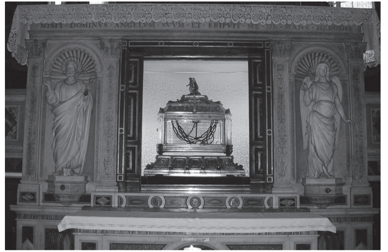
Вериги апостола Петра. Церковь Сан-Пьетро-ин-Винколи. Рим.

рогое наследство, из рода в род, при чем каждый раз родители – детям, а те – своим наследникам, объясняли, какого Великого узника касались эти вериги и чьим телом они освящены. Так перешли они по наследству в руки святейшего иерусалимского патриарха Ювеналия. И когда благочестивая царица Евдокия, супруга царя Феодосия Младшего, возвращалась в Царьград из Иерусалима, – где за время своего пребывания построила много церквей и украсила из своих царских средств святые места, – то патриарх Ювеналий подарил ей за ее благочестие и любовь к святыне немало разных духовных сокровищ. В числе их он подарил ей и эти честные и чудотворные вериги святого апостола Петра. По возвращении в Царьград, Евдокия одну веригу принесла в дар храму святого апостола Петра, находившемуся внутри Великого Софийского собора, а другую послала в Рим своей дочери Евдокии, которая была замужем за римским царем Валентином III-м. Благочестивая, подобно матери, Евдокия с любовью приняла этот драгоценный дар и, построив на Эксквильской