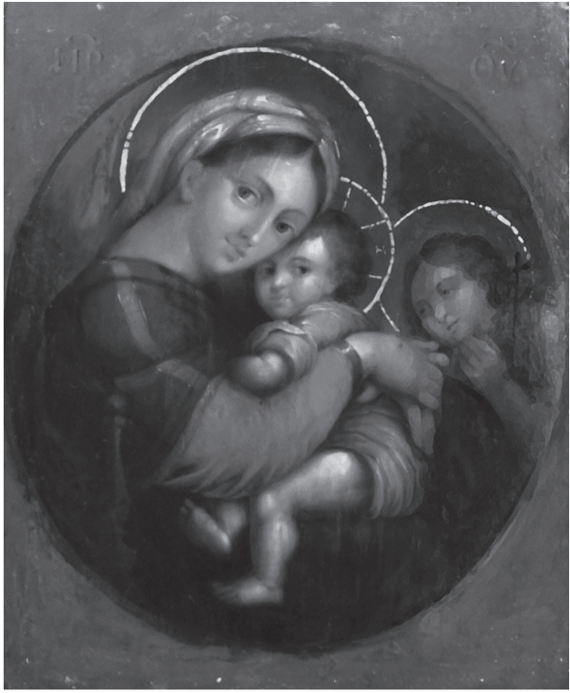
Икона Божией Матери «Три радости»

Судьба иконы Божией Матери «Трех радостей» является едва ли не единственным примером в истории прославленных на Руси богородичных образов, когда икона западного происхождения становится русской чудотворной святыней. Первоначальный образ, по преданию, принадлежал кисти всемирно известного итальянского живописца Рафаэля.