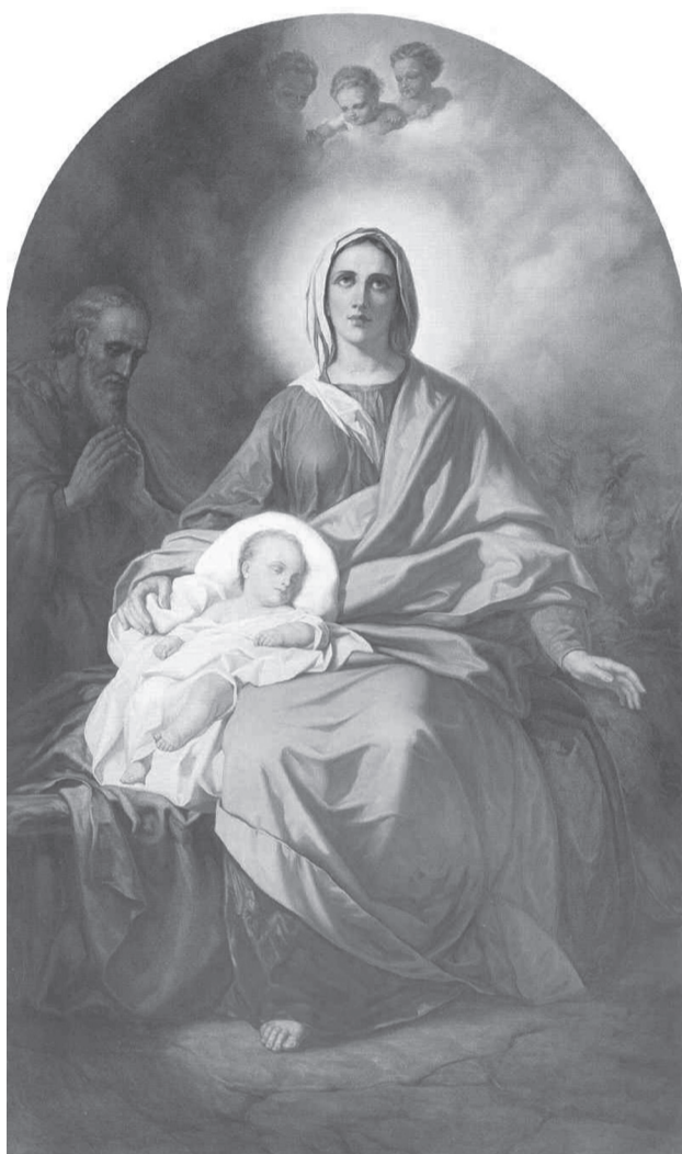
Рождество Христово. Храм Христа Спасителя.

Эту тайну в величайшем восторге воспевают Церковь: «Приидите, возрадуемся Господеви, настоящую тайну сказующе. Средостение градежа разрушишася, пламенное оружие падает, и херувим отступает от Древа жизни, и аз райския пици причащаюся». Церковь объясняет: «Средостение градежа... разрушишася...» – вот такая война окончена, вот какой мир заключен: окончена война с Небом, оборона Неба от зла Земли.