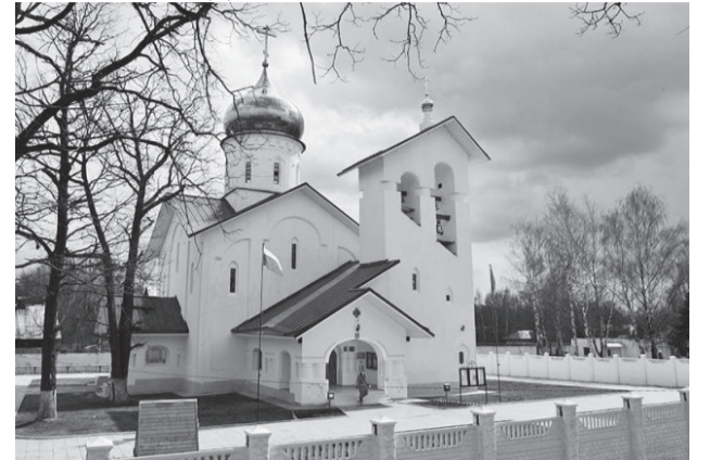
Домовая церковь Софринской бригады оперативного назначения МВД России.

Помимо двух известных образов Божией Матери «Трех радостей» в церкви во имя Живоначальной Троицы, что на Грязех, в Москве чтимые списки с иконы пребывают в двух храмах: в честь Положения честной Ризы Пресвятой Богородицы во Влахерне и в домовый церкви Софринской бригады оперативного назначения МВД России.