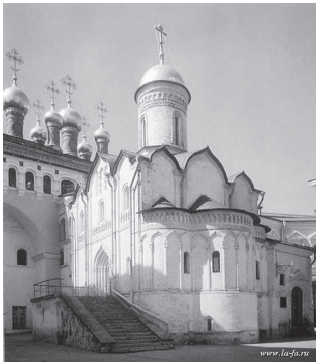
Храм в честь Положения честной Ризы Пресвятой Богородицы во Влахерне

Известно, что икона «Трех радостей» весьма почиталась в царствующем ДOME. Один из списков образа являлся келейной иконой императрицы Марии Александровны, жены Александра II. Он был подарен императрице по обету, данному перед ракой преподобного Сергия ее фрейлиной Анной Федоровной Аксаковой (урожденной Тютчевой), бывшей первой воспитательницей ее сына великого князя Сергея Александровича. После смерти Марии Федоровны образ был возвращен А.Ф. Аксаковой, но ненадолго. Вскоре фрейлина принесла его в дар Сергею Александровичу для его невесты великой княгини Елизаветы Федоровны. В письме своему бывшему воспитаннику Аксакова написала: «Я хотела бы, чтобы Ваша невеста приняла этот образ как благословение, идущее от Вашей матери и от святого, который является покровителем России и который, вместе с тем, и Ваш покровитель».