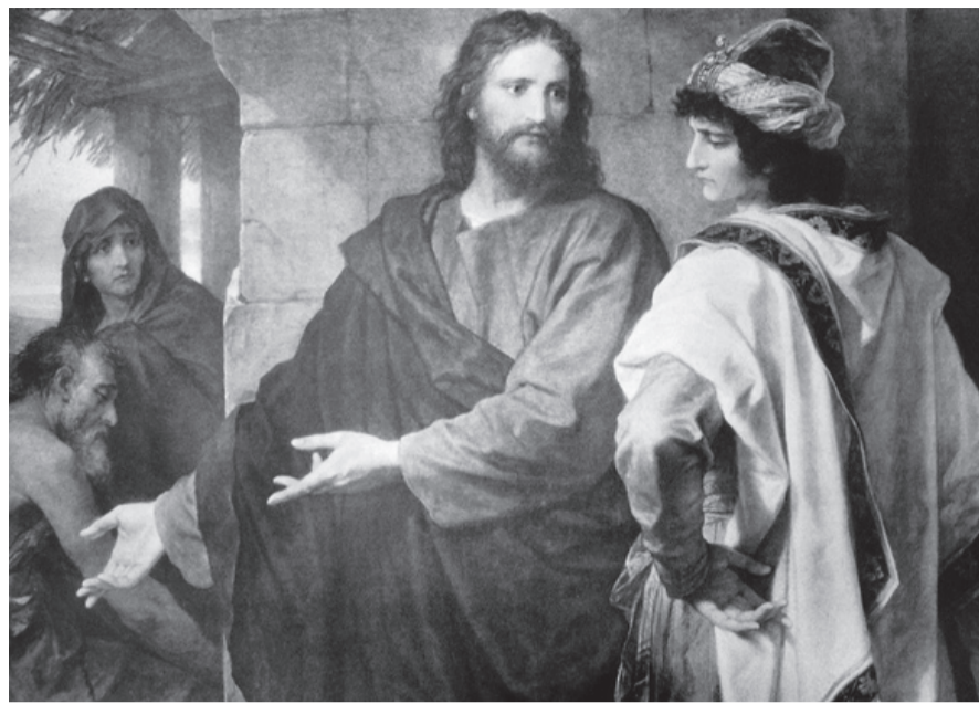
Христос и богатый юноша. Генрих Гофман.

17 Когда выходил Он в путь, подбежал некто, пал пред Ним на колени и спросил Его: Учитель благий! что мне делать, чтобы наследовать жизнь вечную? 18 Иисус сказал ему: что ты называешь Меня благим? Никто не благ, как только один Бог. 19 Знаешь заповеди: не прелюбодействуй, не убивай, не кради, не лжесвидетельствуй, не обижай, почитай отца твоего и мать. 20 Он же сказал Ему в ответ: Учитель! всё это сохранил я от юности моей. 21 Иисус, взглянув на него, полюбил его и сказал ему: одного тебе недостает: пойдй, всё, что имеешь, продай и раздай нищим, и будешь иметь сокровище на небесах; и приходи, последуй за Мною, взяв крест. 22 Он же, смутившись от сего слова, отошел с печалью, потому что у него было большое имение. 23 И, посмотрев вокруг, Иисус говорит ученикам Своим: как трудно имеющим богатство войти в Царствие Божие! 24 Ученики ужаснулись от слов Его. Но Иисус опять говорит им в ответ: дети! как трудно надеющимся на богатство войти в Царствие Божие! 25 Удобнее верблюду пройти сквозь игольные уши, нежели богатому войти в Царствие Божие. 26 Они же чрезвычайно изумлялись и говорили между собою: кто же может спастись? 27 Иисус, возрев на них, говорит: человеку это невозможно, но не Богу, ибо всё возможно Богу.