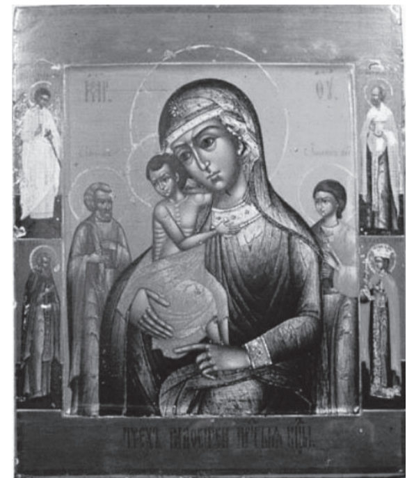
Тропарь, глас 4

Празднование образу Божией Матери, именуемому «Три Радости», совершается 26 декабря / 8 января в день Собора Богородицы, следующий день после Рождества Христова.