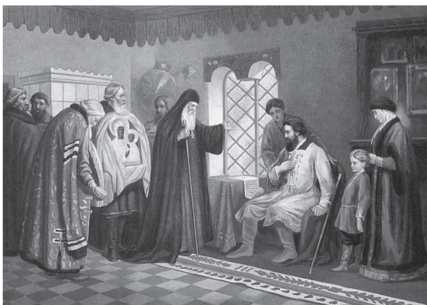
Василий Савинский (1859 – 1937) Нижегородское посольство у князя Дмитрия Пожарского.

Тем временем в Москве начался голод. Первосвяtitель повелел келарю Сергиевой обители Авраамию Палицыну открыть для голодающих монастырские житницы с хлебом.