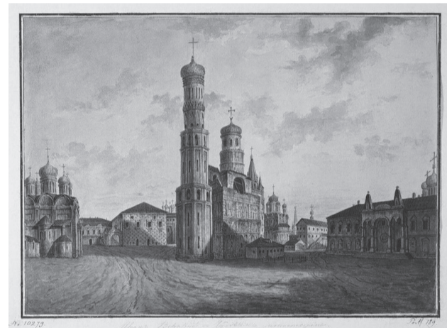
Фёдор Алексеев (1753 - 1824) Иван Великий и Чудов Монастырь.

Вскоре священник Ермолай принял иноческий постриг с наречением имени Гермоген. По всей вероятности, пострижение происходило в Чудовом монастыре, который был назван им впоследствии обетным. В 1587 году он был назначен архимандритом Казанского Спасо-Преображенского монастыря. 13 мая 1589 года владыка Гермоген был хиротонисан во епископа, и в том же году новоизбранный Патриарх Иов возвел его в сан митрополита Казанского и Астраханского. На этой кафедре святитель Гермоген проводил широкую, плодотворную миссионерскую работу среди язычников и мусульман (татар), приводя их к православной вере.