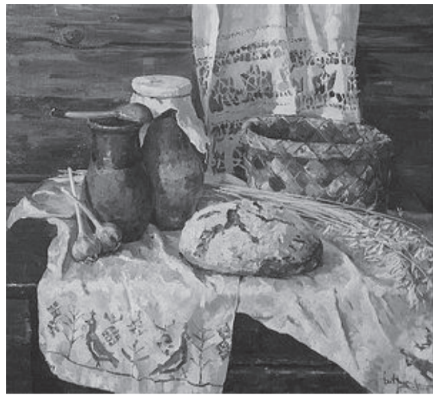
Кирилл Дацук. Русский натюрморт.

Другой аспект духовной жизни, совершенно выпадающий из поля зрения в наши дни, – это то, что православные превратились в каких-то «воскресных