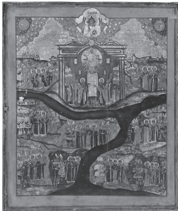
«На реках Вавилонских». Конец XVIII – начало XIX века

– Простите меня, что была строга с вами. Скоро увидимся. Бдите и молитесь, сестры мои.