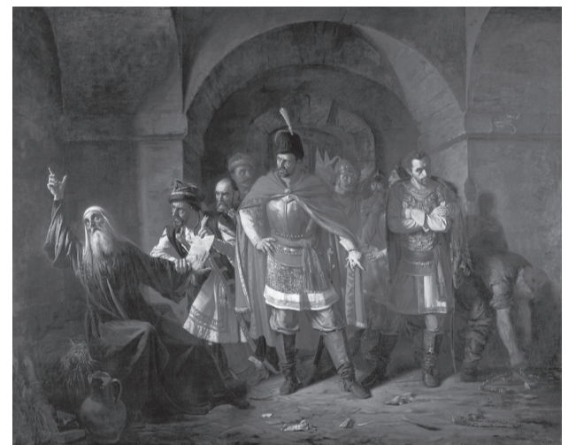
Павел Петрович Чистяков (1832–1919) Патриарх Гермоген отказывает полякам подписать грамоту

В 1610 году самозванец, прозванный «тушинским вором», был убит своими приближенными. К этому времени после боярского заговора и свержения царя Василия Шуйского (в июле 1610 года) Москва была занята польскими войсками. Большинство бояр желало видеть на русском престоле польского королевича Владислава, сына Сигизмунда III. Этому решительно воспротивился Патриарх Гермоген, совершавший в храмах особые молебны об избрании на царский престол «от кровей российского рода». На требование бояр написать особую грамоту к народу с призывом положиться на волю Сигизмунда, Патриарх Гермоген ответил решительным отказом и угрозой анафематствования. Он открыто выступил против иноземных захватчиков, призывая русских людей встать на защиту Родины. По благословию Патриарха Гермогена из Казани была перенесена Казанская икона Пресвятой Богородицы (скорее всего – копия с подлинной), которая стала главной святыней ополчения.