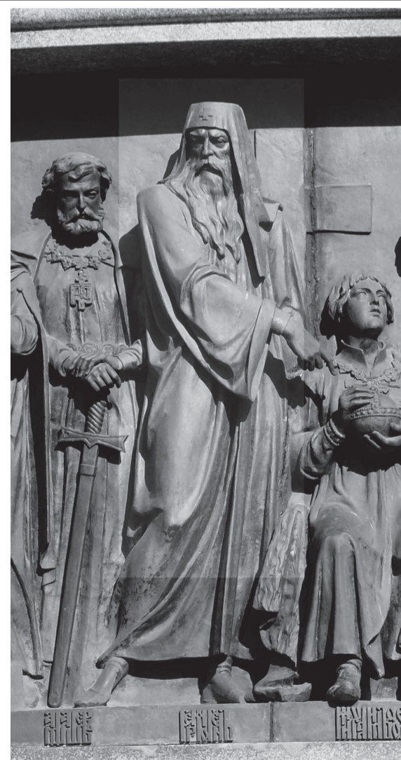
Патриарх Гермоген на Памятнике «1000-летие России» в Великом Новгороде

В 1913 году Русская Православная Церковь прославила Патриарха Гермогена в лике святых. Его память совершается 12/25 мая и 17 февраля/1 марта.