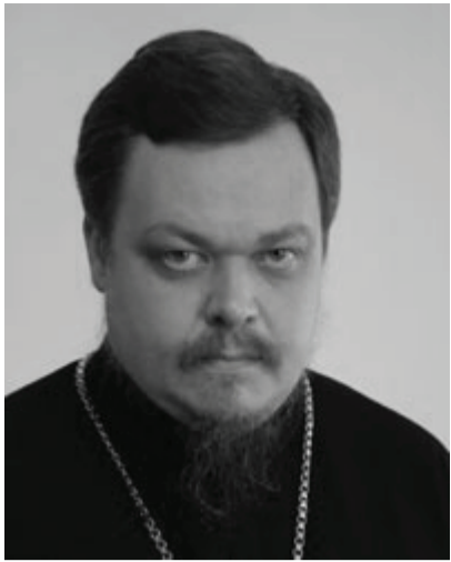
Протоиерей Всеволод Анатольевич Чаплин Председатель Синодального отдела по взаимоотношениям Церкви и общества