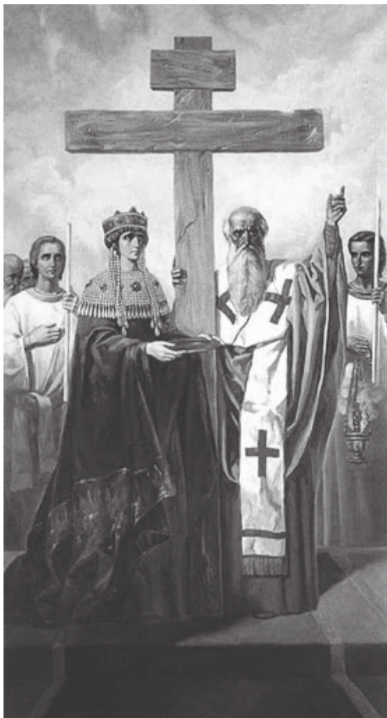
Воздвижение Честного и Животворящего Креста Господня.

Господь “преступил” против людей еще тем, что разо-