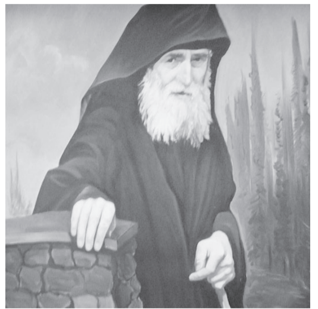
Старец Паисий Святогорец

– А как ты почувствуешь плод молитвы, если перед тем так много времени провел перед телевизором, слушая новости, и сразу после этого начал повечерие? Хорошо бы ты вовсе не смотрел телевизор. Но если смотришь, то после этого, прежде чем встать на молитву, согрейся душой, прочитай главу из Евангелия или отрывок из святых отцов, чтобы сначала как бы войти в прихожую, а потом уже в комнату для молитвы. И тогда ты почувствуешь молитву.