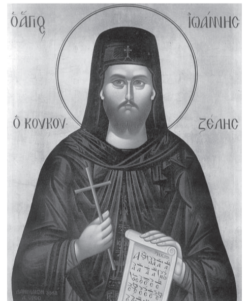
Преп. Иоанн Кукузель

14 октября по новому стилю — день памяти преподобного Иоанна Кукузеля (XII век) — покровителя певчих. В детстве маленького певчего друзья спрашивали: «Что ты ел сегодня, приятель?» «Куку» (бобы) и зелия», — отвечал он. С тех пор его прозвали «Кукузель». За прекрасный голос св. Иоанна взяли ко двору Византийского императора. Мальчик был сиротой, и его очень полюбили, а когда он повзрослел, император хотел женить его на красивой девушке. Однако юно-