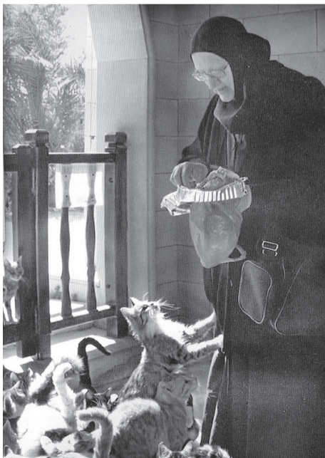
В монастыре свт. Николая на Кипре

Наша земля, моря и реки, растения, животные и мы с вами — Божьи создания, дела рук Его. «Как многочисленны дела Твои, Господи! Все соделал Ты премудро; земля полна произведений Твоих!» (Пс. 103, 24). А человек — это особенное творение Бога. Потому что Господь наделил