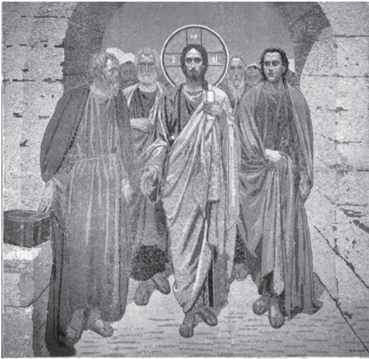
Призвание апостола Матфея

27 После сего Иисус вышел и увидел мытаря, именем Левия, сидящего у сбора пошлин, и говорит ему: следуй за Мною. 28 И он, оставив все, встал и последовал за Ним. 29 И сделал для Него Левий в доме своем большое угощение; и там было множество мытарей и других, которые возлежали с ними. 30 Книжники же и фарисеи роптали и говорили ученикам Его: зачем вы едите и пьете с мытарями и грешниками? 31 Иисус же сказал им в ответ: не здоровые имеют нужду во врачех, но больные; 32 Я пришел призвать не праведников, а грешников к покаянию.