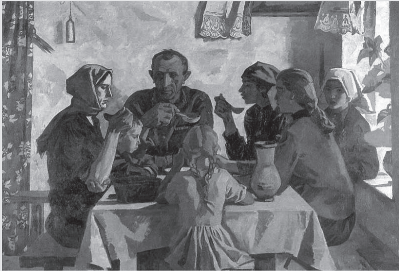
Портрет семьи. Художник В. Иванов

Может ли быть конфликт между супругами или детей с родителями в православной семье? Первое, что приходит в голову,— все недоразумения должны гаснуть, едва зародившись, ведь в христианской семье любовь — нелицемерная, жертвенная, терпеливая. Но наши семьи, скорее, пока еще только стремятся стать по-настоящему православными.