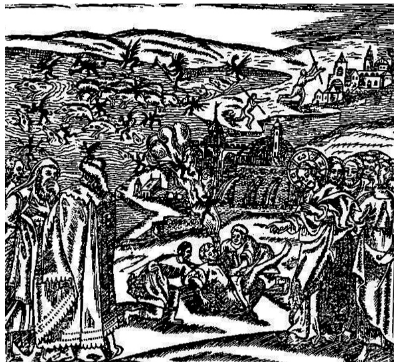
Исцеление гадаринского бесноватого, требник Святителя Петра Могилы, том 3, 1646 г.

Есть мания боязни, страха суетного, когда человек боится подобных себе или всего окружающего боится, всех подозревает в злых умыслах или вообще предполагает во всех недобрые мысли, намерения; мания брезгливости, когда считают нечистыми всех и все и десять или двадцать раз перемывают