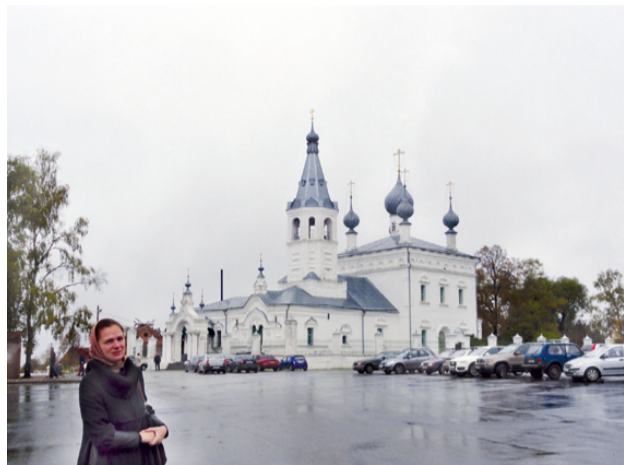
Храм свт. Иоанна Златоустого в Годеново

Здравствуйтесь! Это я, ваша соседка сверху. Забегала на минутку. Да, давно не виделись. Сами знаете, «суета сует и всяческая суета». На самом деле, жизнь так и пролетает: забота, работа, старики, дети. Оглянешься – и вспомнить нечего. Хотя один день из этого заведенного круга врезался в память. Это была наша паломническая поездка. От храма Серафима Саровского.