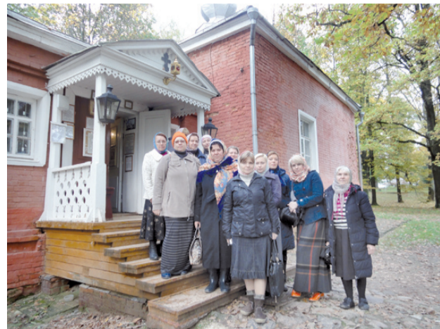
Наша группа на крыльце храма Спаса Нерукотворного в Мураново

Быть военным священником – служение нелегкое. Путь, пройденный бригадой оперативного назначения из подмосковного Софрино, по-настоящему бо-