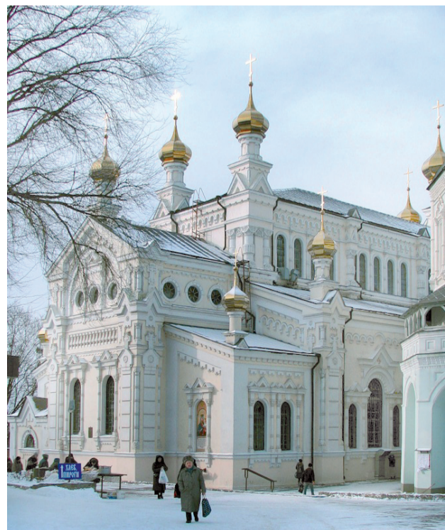
Церковь Озерянской Иконы Божией Матери. Харьков.

Описание святыни, сделанное в начале XX века Д.И. Багалеем и Д.П. Миллером, оказалось тем источником, опираясь на который Озерянская икона, погибшая в 1930-е годы, была воссоздана в начале уже XXI столетия – в сентябре 2010 года. 16 сентября того же года этот воссозданный образ был освящен на месте его обретения – в Озерянах, а в настоящее время находится в Крестовоздвиженском храме Покровского мужского монастыря (Харьковская епархия).