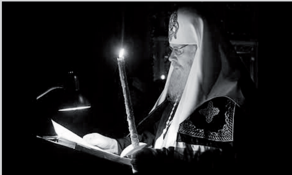
Великое повечерие с чтением Великого канона святого Андрея Критского в храме Пюхтицкого подворья 21 февраля 2007г, совершенное Святейшим Патриархом Алексием II.