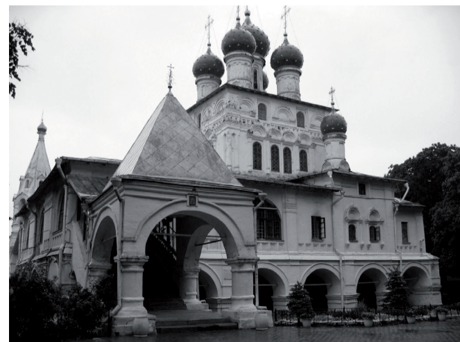
Храм Казанской иконы Божией Матери, Коломенское

Торжество в честь этой явленной и чудотворной иконы совершается 2/15 марта.