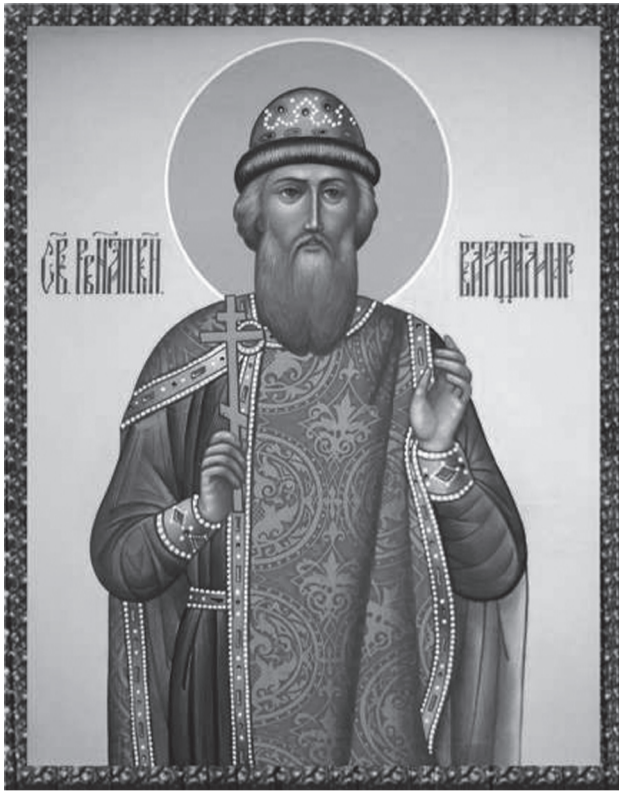
День памяти – 15 / 28 июля

Любовь к земным сластям, пороки и суеверия покрывали Владимира с головы до ног. Но нутро его, как