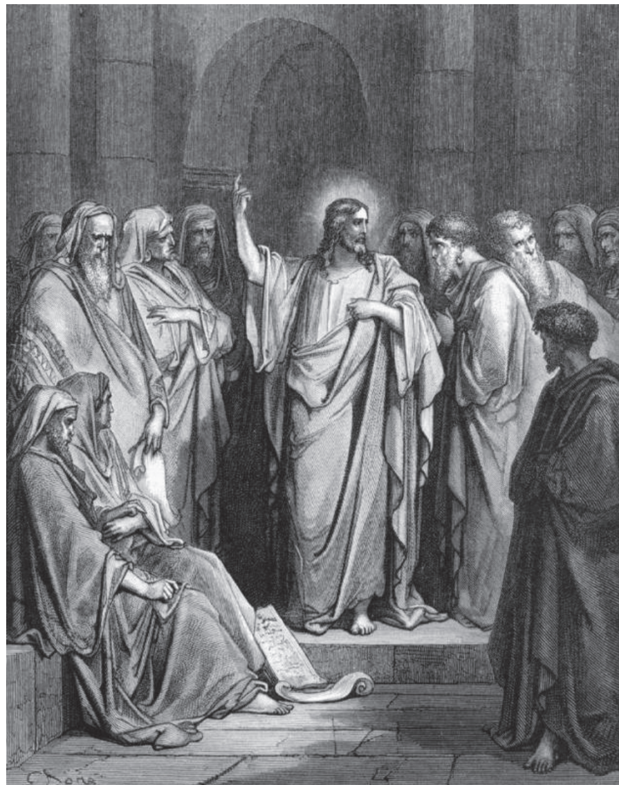
Густав Доре. Проповедь в синагоге.