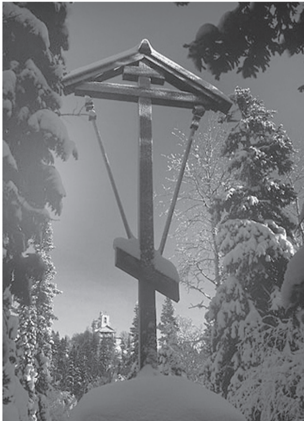
Поклонный крест в память новомучеников и исповедников соловецких в Голгофо-Распятском скиту на острове Анзер

Попав в барак, баронесса была там встречена не «в штыхки», а более жестоко и враждебно. Стимулом к травле ее была зависть к ее прошлому. Женщины не умеют подавлять в себе, взнуздывать это чувство и всецело поддаются ему.