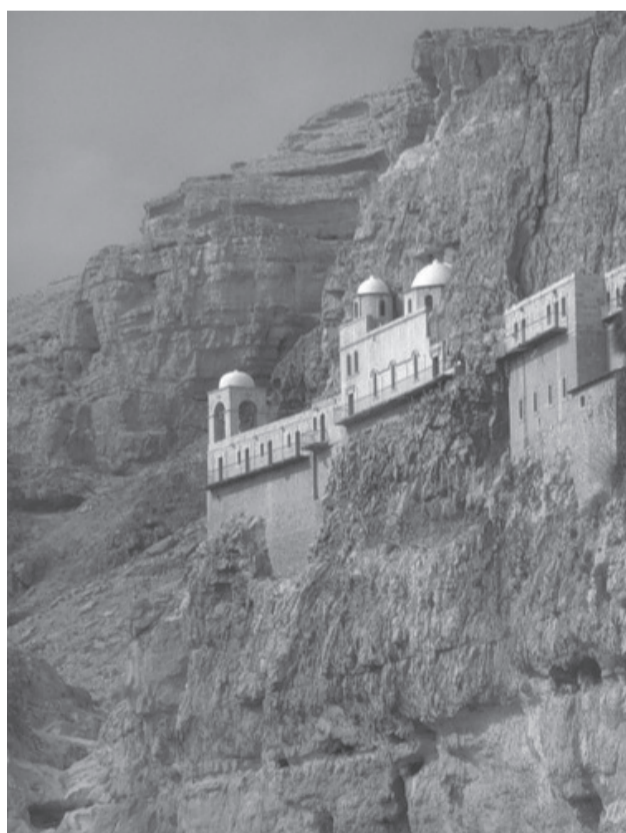
Монастырь Искушения или монастырь Каранталь. Православный греческий мужской монастырь

Раба Божия Алла, материал подготовлен на основе проповеди митр. Смоленского и Калининградского Кирилла