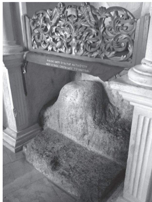
Камень на горе Искушений, на котором молился Христос

«И приступил к Нему искушитель и сказал: если Ты Сын Божий, скажи, чтобы камни сии сделались хлебами. Он же сказал ему в ответ: написано: не хлебом одним будет жить человек, но всяким словом, исходящим из уст Божиих. Потом берет Его диавол в святой город и поставляет Его на крыле храма, и говорит Ему: если Ты Сын Божий, бросься вниз, ибо написано: Ангелам Своим заповедает о Тебе, и на руках понесут Тебя, да не преткнешься о камень ногою Твоею. Иисус сказал ему: написано также: не искушай Господа Бога твоего. Опять берет Его диавол на весьма высокую гору и показывает Ему все царства мира и славу их, и говорит Ему: все это дам Тебе, если, нав, поклонись мне. Тогда Иисус говорит ему: отойди от Меня, сатана, ибо написано: Господу Богу твоему поклонись и Ему одному служи. Тогда оставляет Его диавол, и се, Ангелы приступили и служили Ему» (Мф. 4. 3-11).