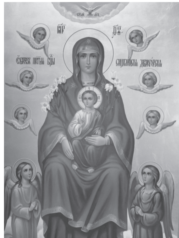
Икона Божией Матери «Дивногорская» (Сицилийская)

Иверская находится в надвратной церкви Иверской обители на Афоне, также называется «Вратарницей» или «Портаитиссою» по месту пребывания над монастырскими воротами.