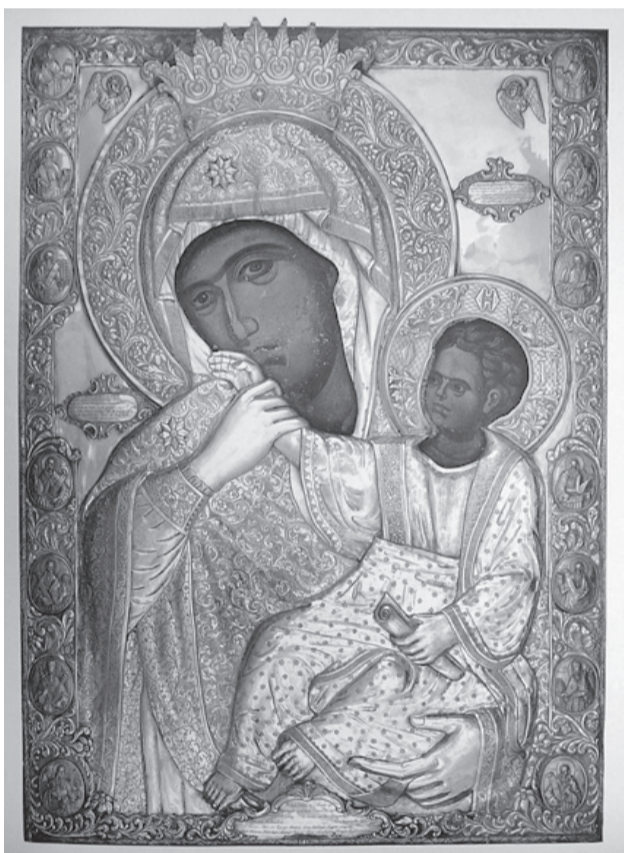
Икона Божией Матери «Ватопедская». XV век

Ватопедская («Отрада» или «Утешение») находится в Ватопедском монастыре на Афоне в храме Благовещения Пресвятой Богородице.