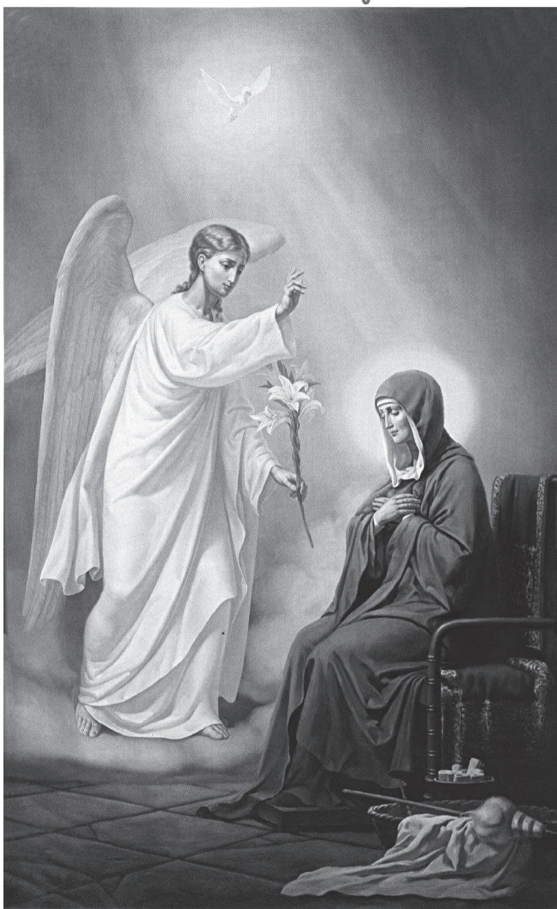
7 апреля - Благовещение Пресвятой Богородицы

О чем эта правда? Что случилось, когда молодая женщина, почти девочка, услышала внезапно – из какой глубины, с какой высоты! – это удивительное приветствие: «Радуйся!» Ведь вот что сказал Марии ангел: «Радуйся!»