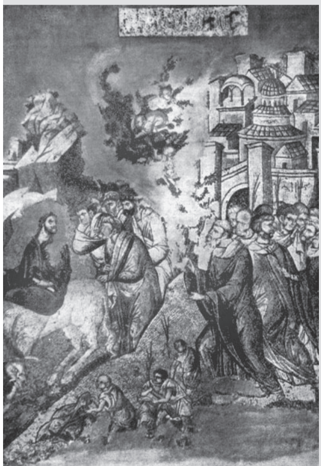
Вход Господень в Иерусалим. 1312–1315 гг. Мозаика церкви святых апостолов в Фессалониках (Греция)

ви святителя Николая со Усохи) Спаситель представлен сидящим ногами вперед, а левое плечо повернуто на зрителя так, что Он въезжает в Иерусалим почти что спиной вперед. Отметим в двух этих памятниках по-особому выделенную фигуру апостола, представленного за Христом. В отличие от других учеников, святой Петр изображен здесь почти строго в фас и смотрит не в ту сторону, куда направляется процессия, а прямо на зрителя.