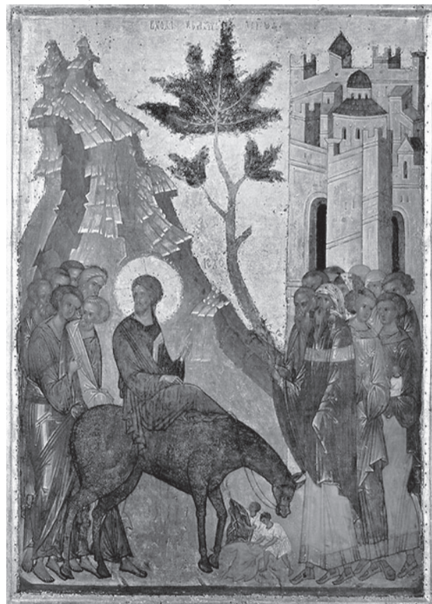
Вход Господень в Иерусалим. Около 1497 г. Икона из праздничного ряда иконостаса церкви Успения Кирилло-Белозерского монастыря.

крепко держащей за руку сидящего у нее на плечах ребенка. Трогательна и небольшая бытовая сценка, представленная на двухсторонней иконе из святцев новгородского Софийского собора (конец XV в.) и на идентичной по иконографии иконе из ряда суздальских святцев (вторая половина XVI в.). Один из мальчиков сидит, согнув ногу в колене, а другой помогает ему вытащить из ступни занозу.