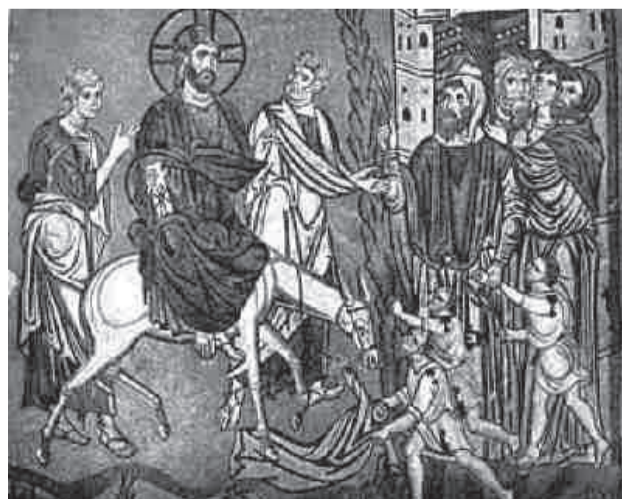
Вход Господень в Иерусалим. Вторая половина XI в. Мозаика церкви Успения Богородицы в Дафни (Греция)

В нижней части композиции изображаются дети, радующиеся пришествию Спасителя. Упоминаний о встрече Христа детьми не содержится у святых евангелистов, однако о детях с пальмовыми листьями в руках, восклицавших: «Осанна!» – говорится в апокрифическом Евангелии от Никодима. В мозаике Палатинской капеллы один из мальчиков стягивает с себя рубашку, чтобы постелить ее на дорогу, другой держит пальмовую ветку. На миниатюре из Россано, на эпистилии из Синайского монастыря святой Екатерины, а также на других многочисленных византийских и русских памятниках дети с вайями изображаются у ног ослика, карабкающимися на дерево или ломающими с него ветви, а также сидящими на плечах или на руках у родителей, вышедших из Иерусалима навстречу Спасителю. На фреске из церкви святого Пантелеимона в Нерези (Македония, 1164 г.) в толпе встречающих чрезвычайно выразителен образ женщины,