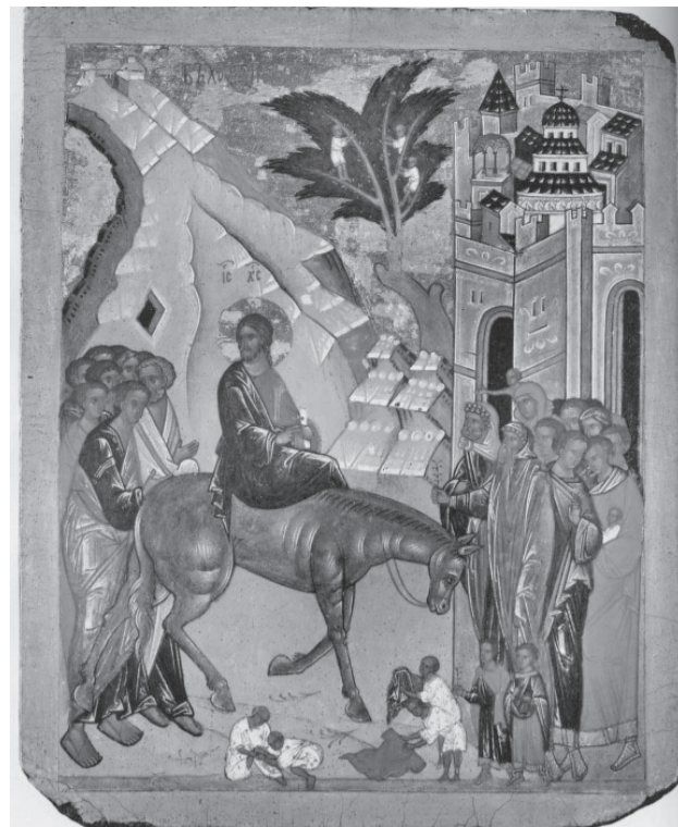
Вход Господень в Иерусалим. Конец XV в. Лицевая сторона двухсторонней иконы

крепко держащей за руку сидящего у нее на плечах ребенка. Трогательна и небольшая бытовая сценка, представленная на двухсторонней иконе из святцев новгородского Софийского собора (конец XV в.) и на идентичной по иконографии иконе из ряда суздальских святцев (вторая половина XVI в.). Один из мальчиков сидит, согнув ногу в колене, а другой помогает ему вытащить из ступни занозу.