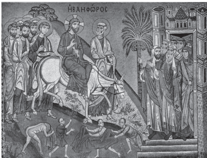
Вход Господень в Иерусалим. Середина XII в. Мозаика Палатинской капеллы в Палермо (Италия)

Не восхитившись торжественной встречей, сделанной Ему в Иерусалиме, Спаситель благосклонно остановил Свое внимание только на детях, на младенцах, вещавших Ему: «Осанна». Этим Он указал, какой восторг соответствует достоинству человека. Восторг есть выражение чистого, безупречного, живого, беззлобного сердца. Всем людям, однако, без различия возраста, влагается