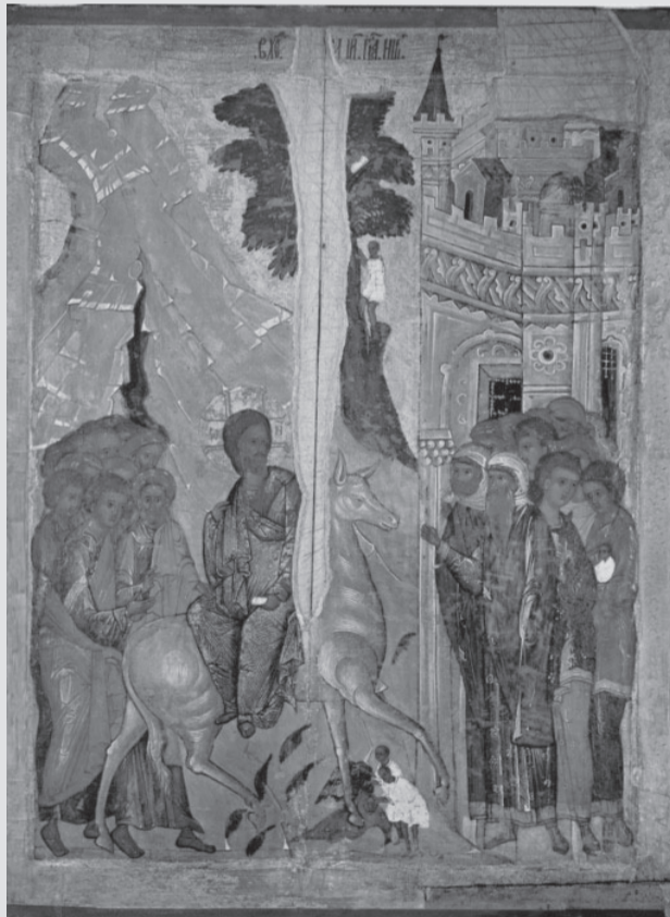
Вход Господень в Иерусалим. Середина XVI в. Икона из праздничного ряда иконостаса церкви святителя Николы со Усохи в Пскове. Государственный Русский музей.

иконографии она примечательна и тем, что осленок, на котором сидит Господь, движется в противоположную от города сторону, так что позади него остаются не только апостолы, но и толпа встречающих.