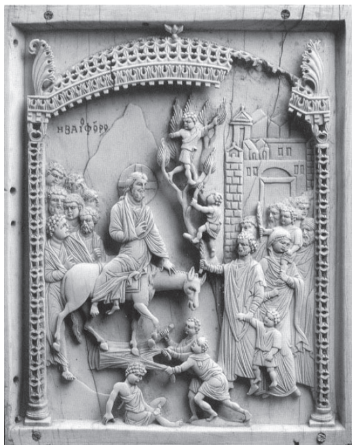
Вход Господень в Иерусалим. X в. Слоновая кость. Музей византийского искусства, (Берлин, ФРГ)