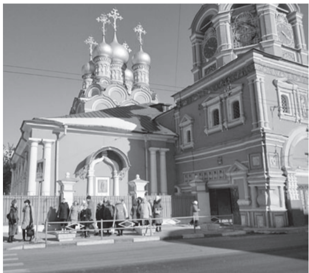
Храм Григория Неокесарийского в Дербицах.

Новоспаский монастырь. Здесь еженедельно на