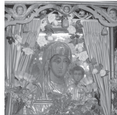
Икона, перед которой обрела покаяние преподобная Мария Египетская

В Храме Гроба Господня, в приделе св. Иакова, брата Господня, находится чудотворная икона Божией Матери, перед которой обрела покаяние Мария Египетская. Когда-то она, александрийская блудница, безуспешно пыталась войти в храм Воскресения Христова. Но невидимая сила Божия не допустила. Тогда Мария возвела взор на образ Пресвятой Богородицы, и благодать Божия озарила совесть грешницы. Она тотчас увидела всю глубину и мерзость своих беззаконий, и от этой иконы получила благословение на святой подвиг.