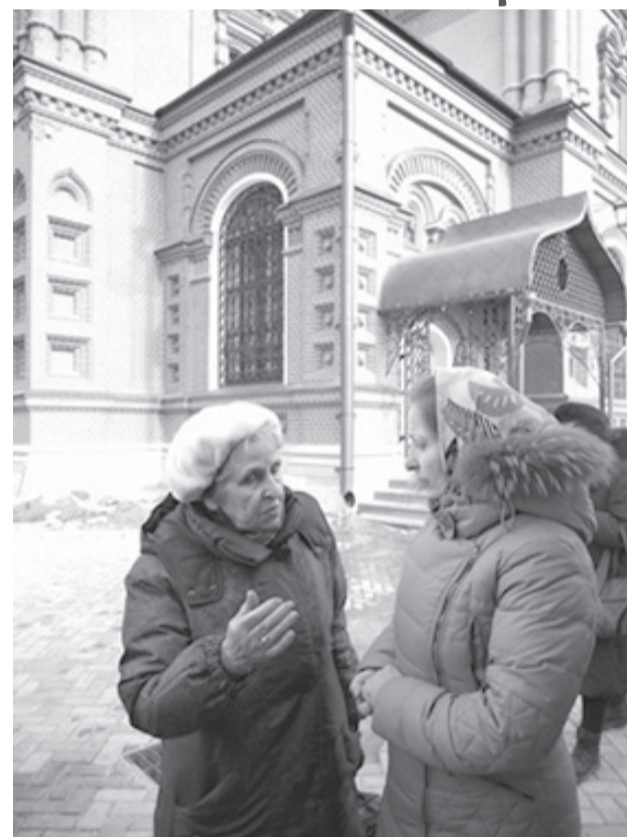
Наши прихожане в Гефсиманском Черниговском скиту

Конечно, главное в любой поездке - люди, которые рядом. В паломничестве это особенно важно. В пути многие из нас, даже почти незнакомые люди, в процессе общения,