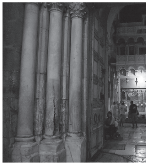
Колонна, из которой вышел Благодатный огонь

Пройдя глухой неприметный двор, мощеный плитами, паломник оказывается перед двумя входами в храм, оформленными крутыми каменными арками. Один вход замурован, перед другим, слева от тяжелых деревянных дверей, стоят три колонны. Одна расколота снизу доверху. И вот почему. В XVI в. армянское духовенство добилося у турецких властей того, чтобы православные не были допущены ко Гробу в Великую субботу. Армяне тщетно ожидали Благодатный Огонь в Кувуклии. Православного же Патриарха в храм не пустили, и он с пастовой молился на улице. Тогда из колонны у входа в храм вышел огонь, образовав трещину, которую видно и поныне.