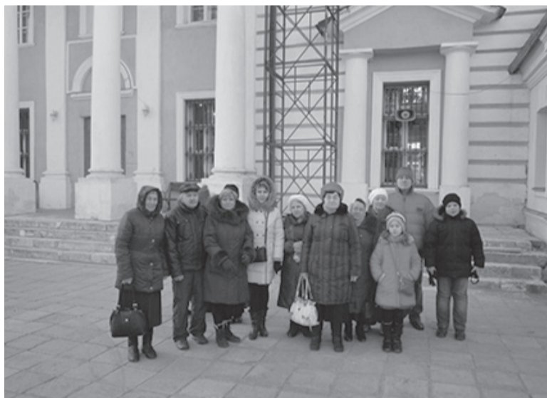
Паломники Серафимовского храма после Божественной Литургии

1. Хотьково. Преподобный Сергий дал заповедь - прежде чем прийти к нему, поклониться его родителям. Сила заступничества Божией Матери, прп. Кирилла и Марии и прп. Сергия проявляется в чудесах, совершающихся на протяжении всей истории существования Хотькова монастыря. Как хорошо и легко было стоять на службе в монастырском храме! Душой овладевало праздничное настроение и умиротворение.