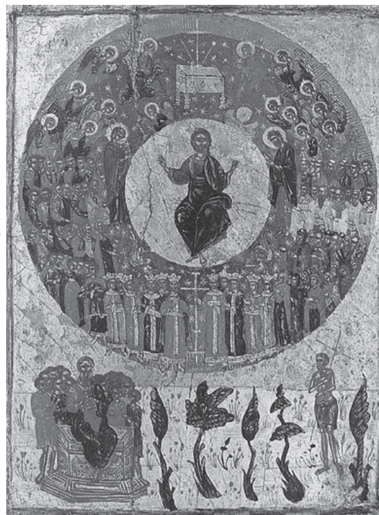
Второе пришествие. Греция. Около 1700 г.

На крестном пути нашем ежеминутно должна переноситься наша мысль к страдающему Христу. Сострадая Господу, душа страдает о себе самой. Есть слезы надрывающие, слезы тоски, уныния, досады; есть же слезы сострадания, любви, утешения и благодарности. На этих слезах растут упования, и ими возвращается наше истинное счастье, счастье непреходящее. Блаженны те очи, которые будут источать