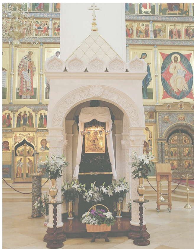
Икона Божией Матери «Милостивая» в Соборе Зачатьевского монастыря

24 ноября 2000 года в новом деревянном храме преподобного Серафима Саровского было отслужено первое Всенощное Бдение, а на следующий день – первая Литургия в праздник иконы Божией Матери «Милостивая». Этот день стал особой памятной датой для нашего прихода.