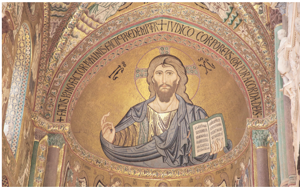
Спас Вседержитель. Мозаика XII в. Собор Преображения Господня в Чефалу, Сицилия.

Сказав это, Господь преподает им учение и о достохвальном мире. Указав похвальное разделение, показывает и мир беспорочный. Именно говорит: когда соперник повлечет тебя в судилище, то еще на дороге всячески постарайся разделиться с ним. Или иначе: «постарайся освободиться» разумеется в таком смысле, что хотя бы ты и ничего не имел, но возьми взаймы под проценты и «постарайся освободиться», чтобы тебе разделиться с ним, «Чтобы он не привел тебя к судье, а судья не отдал тебя истязателю, а истязатель не вверг тебя в темницу, пока не отдашь и последней полушки». Господь говорит это с тем,