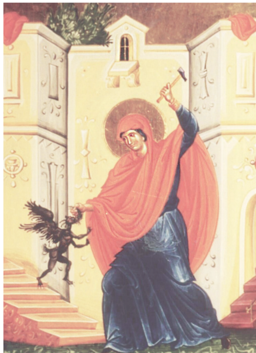
Икона «Святая Марина» (побивающая беса). 1857 г., Лазарос. Афины. Византийский музей.