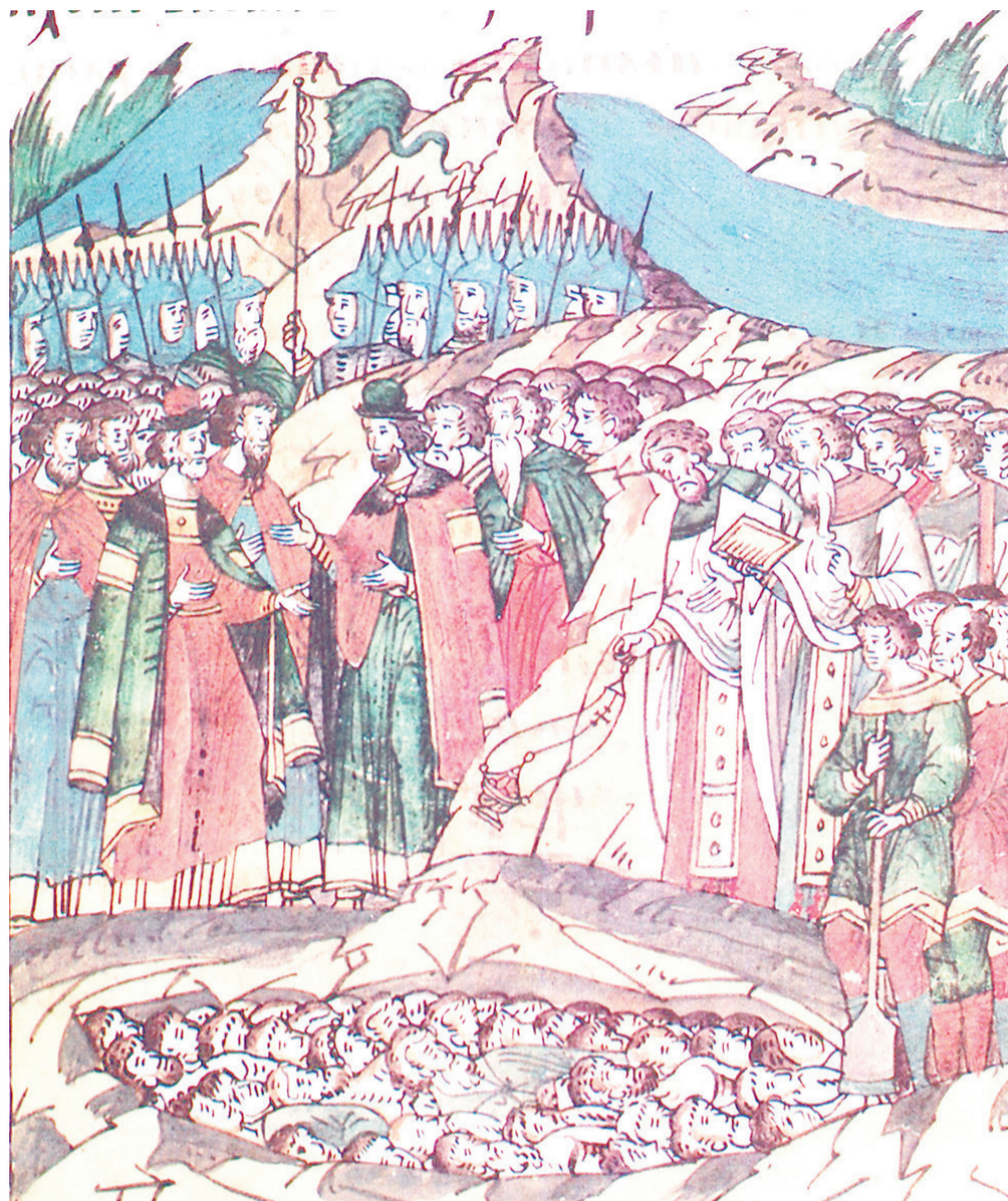
Погребение павших воинов после Куликовской битвы. 1380 г. Лицевой летописный свод XVI в.

человек, входя в Божий храм и принося свои духовные жертвы Господу, вступает в существенное единство веры и любви с почившими от века сродниками, восстанавливает оборванную нить единения «века нынешнего и века минувшего», становится законным преемником боевой славы предков, наследником их завоеваний на благо Отчизны. Наконец, поминая наших усопших воинов, мы обретаем в сердцах дух Воскресшего из мертвых Христа Спасителя... Наши души живо предчувствуют тот ведомый Богу час, когда «гробы отверзутся» – и мы узрим, лицом к лицу, наших почивших сродников. Через Церковь-Мать мы вступим в таинственное общение с ними, единым сердцем и устами славя победителя смерти Христа!