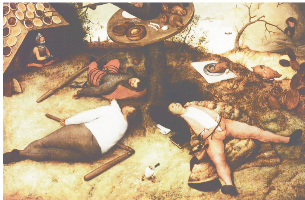
Питер Брейгель «Страна лентяев», 1567 г.

Но все эти внешние примеры я счел нужным привести в первую очередь для того, чтобы проиллюстрировать болезнь духовную. Эта болезнь самым явным образом проявляется в нас тогда, когда речь заходит о тех изменениях, без которых для нас становится невозможным дальнейшее движение к Богу. Человек, придя в Церковь, это движение к Богу начинает, оно какое-то время длится, но рано или поздно мы сталкиваемся с препятствием – с чем-то, от чего нам крайне трудно отказаться. Это, как правило, уже не какие-то грубые грехи и пороки – от них, как ни парадоксально, по сравнению со всем