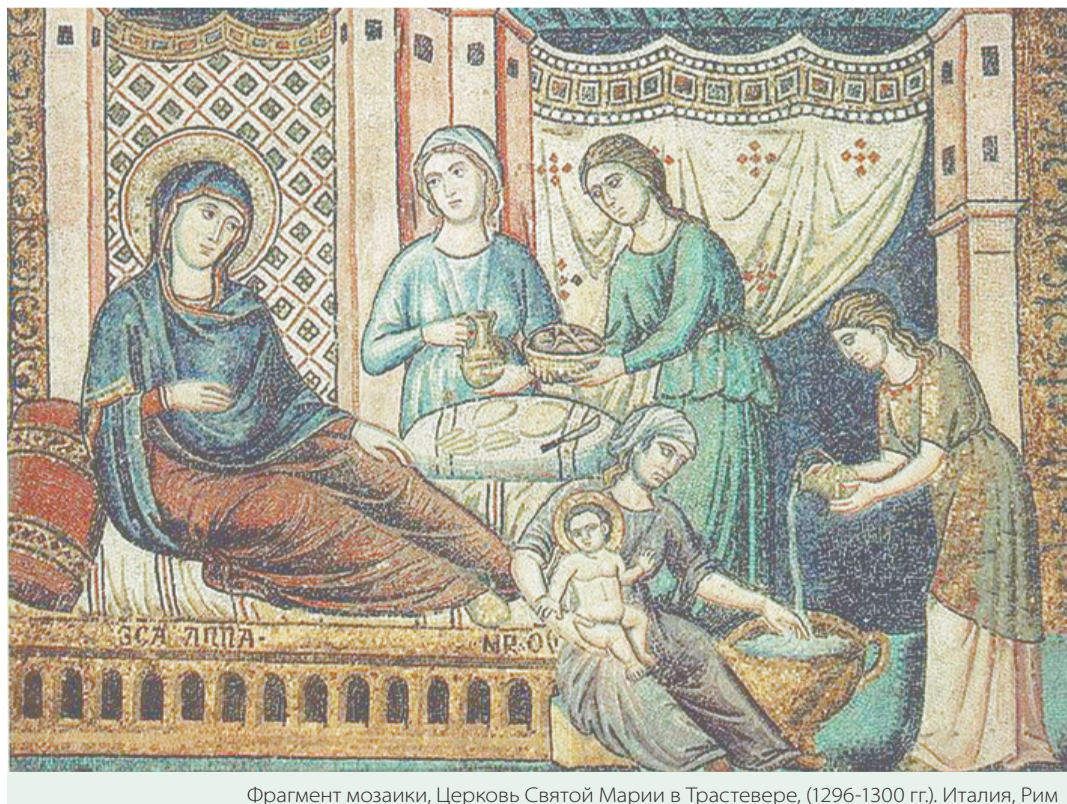
Фрагмент мозаики, Церковь Святой Марии в Трастевере, (1296-1300 гг.). Италия, Рим