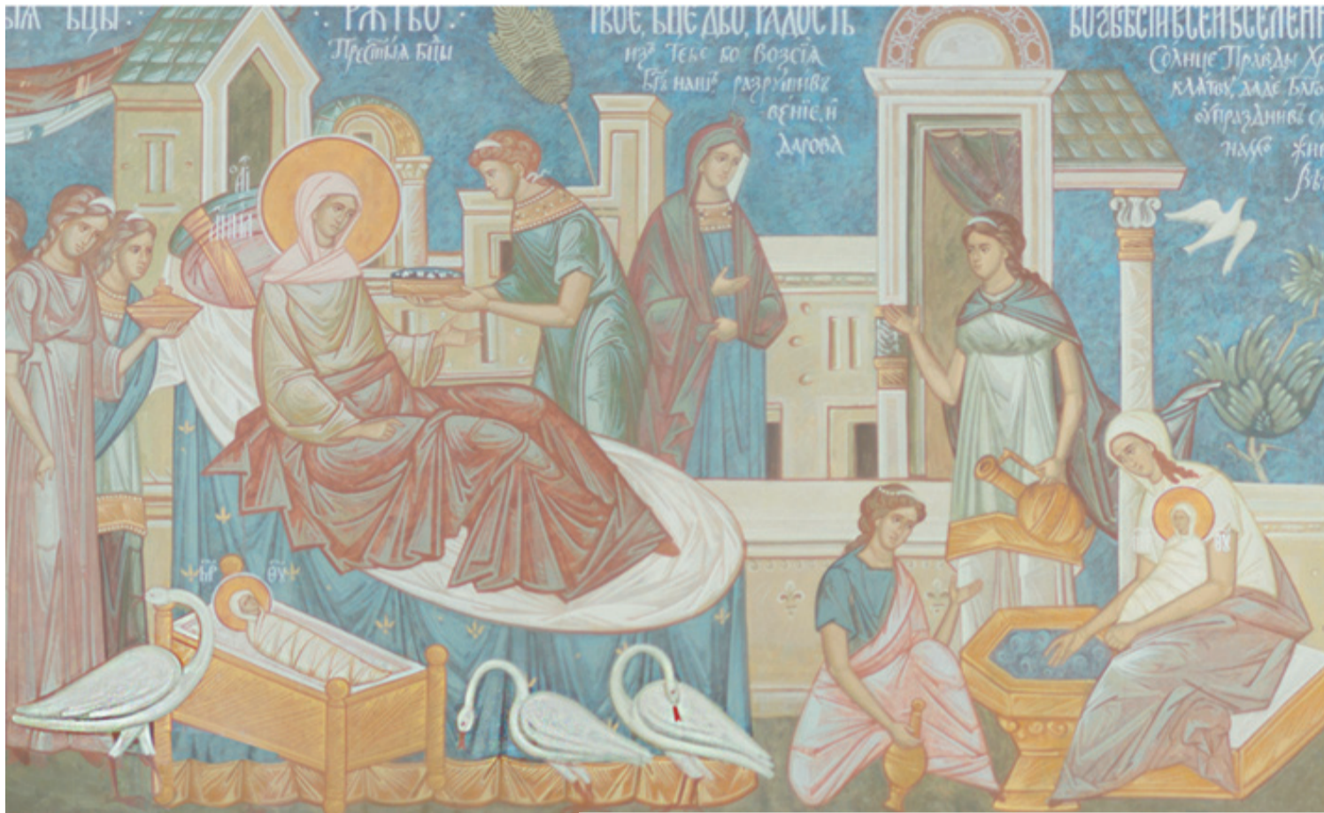
Фрагмент росписи Богородицерождественского храма в Костино (2006-2016 гг.)

Газета прихода Серафимовского храма, г. Королев Московской области