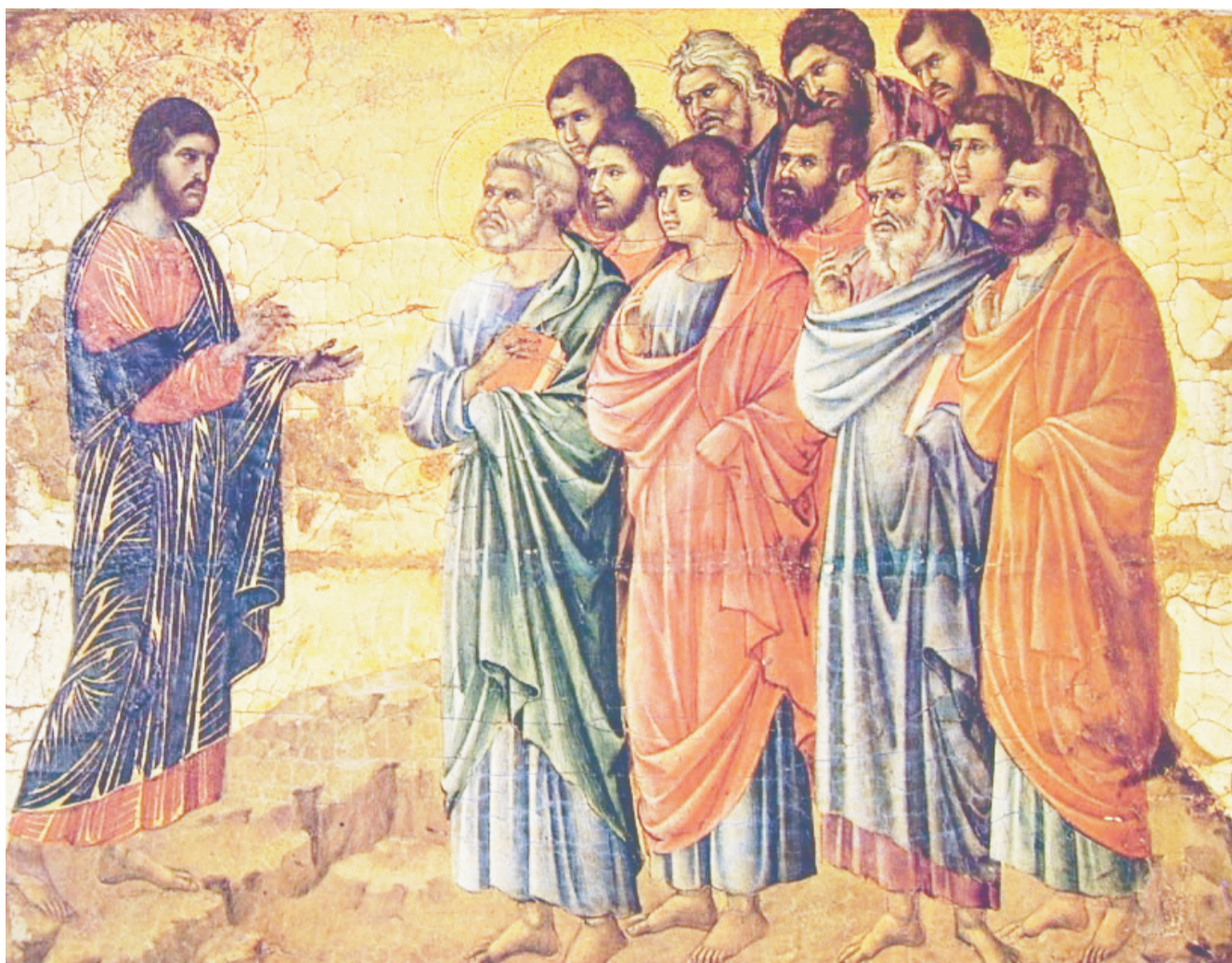
Дуччо ди Буонинсеня. Фрагмент алтарного образа «Маэста», 1308-1311гг., Сиенский собор, Италия

Блж. Феофилакт Болгарский. Толкование на Евангелие от Иоанна.