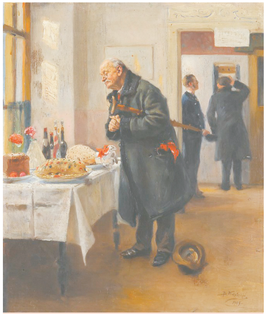
Маковский Владимир Егорович (1846-1920 гг.). Гастроном. 1909 г.

После ночной службы, как известно, все разговляются. Треск яичной скорлупы, запах колбасной нарезки, радостные объ-