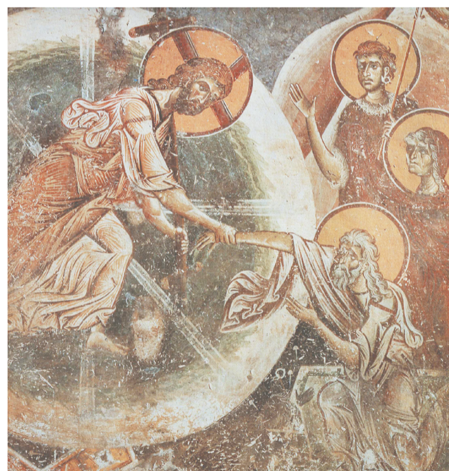
Сошествие во ад. Фреска 1191 г. Церковь св. Георгия, Курбиново, Македония

Не забудем, дорогие друзья, сегодня, в день пасхальный, в день Радоницы, уже ближе к вечеру, отходя ко сну, может быть, еще раз перебраться в сердце своем имена дорогих нашему сердцу усопших родственников, как мы это делаем, перебирая четочки, одну бусинку за другой, молясь за наших ближних. Ведь, делая так, молитвенно вспоминая усопших, мы, сами того не ведая, исполняем кардинальную заповедь Десятословия: «Чти отца и мать твою – да благо ти будет и да долголетен будешь на земли».