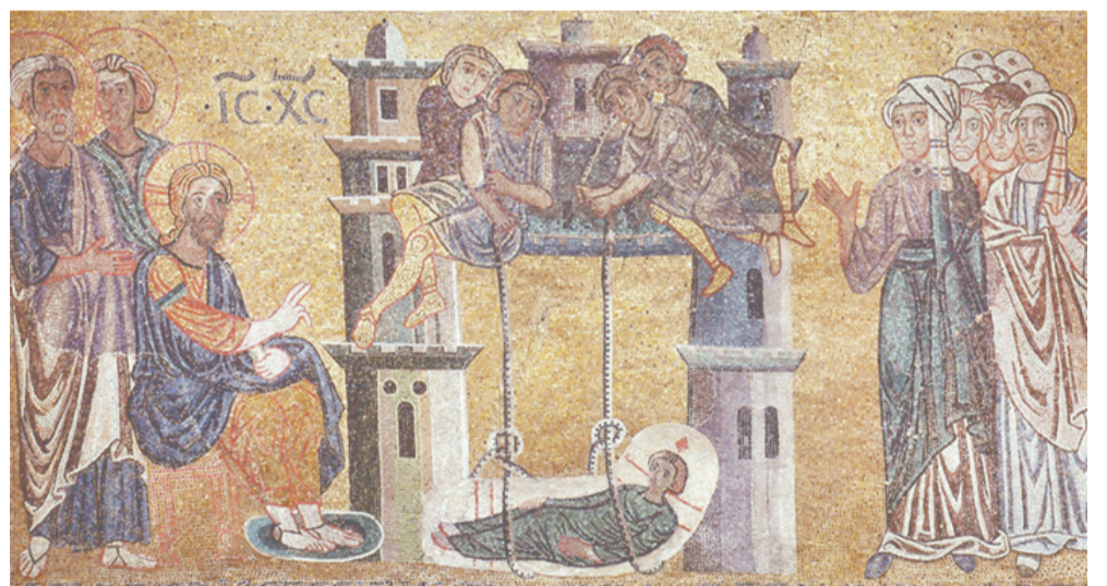
Исцеление расслабленного. Италия. Венеция. Собор Святого Марка; XIV в.

Сегодняшнее евангельское чтение призывает нас также задуматься и о том, что