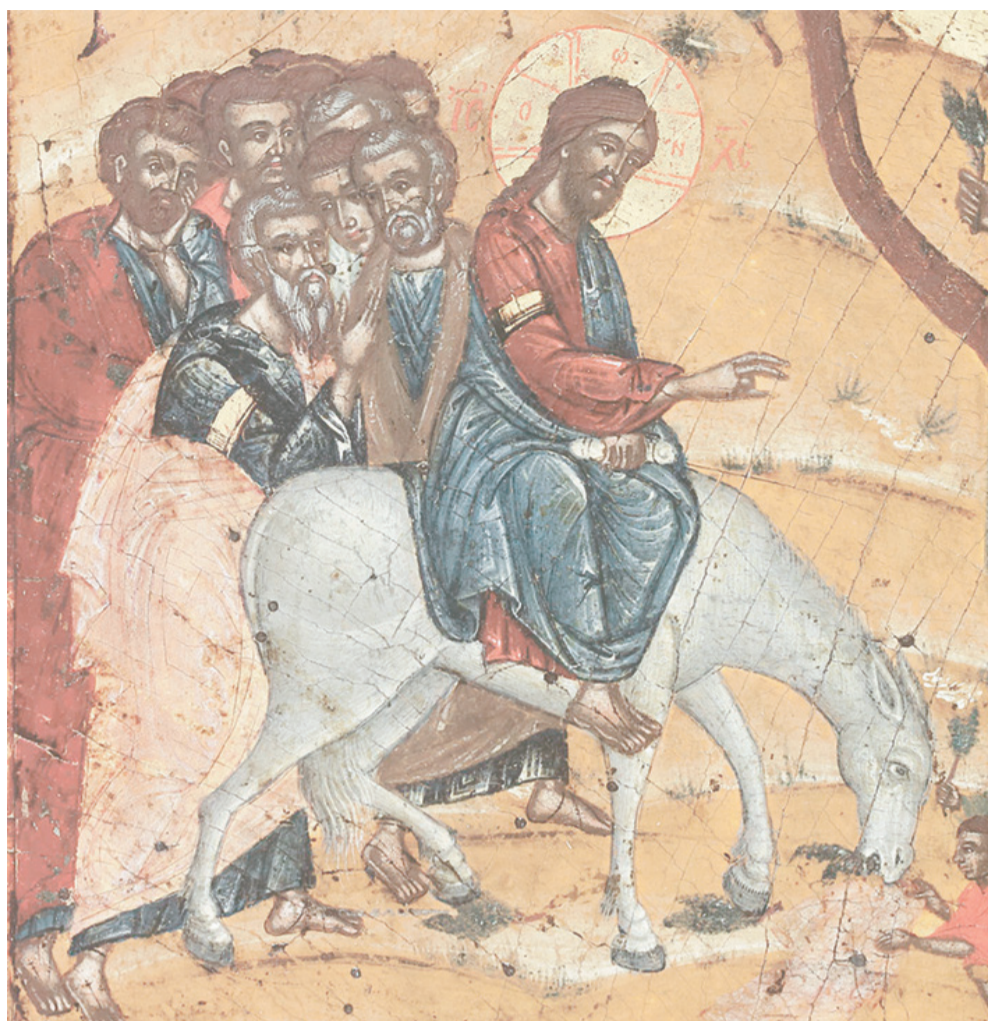
Фрагмент иконы «Вход Господень в Иерусалим»; Греция. Крит; XVII в.

Именно для того приходит сегодня Господь, и потому Он себя провозглашает истинным Мессией, то есть Царем, Пророком и Священником. Царем, который пришел спасти своих подданных. Священником, который пришел принести в жертву Богу-Отцу кровь Свою, проливаемую за наше спасение. Пророком, который пришел установить последний и окончательный Завет, между Богом и людьми. Он пришел и являет Себя перед всеми как Царь и Властелин, кого ждали пророки, о ком молились двенадцать колен Израилевых день и ночь.