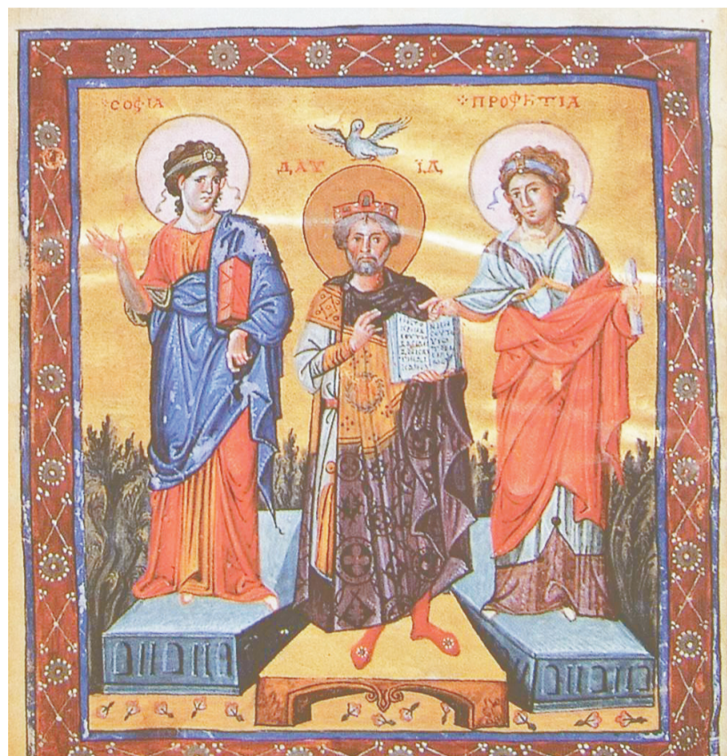
Праведный царь Давид между Мудростью и Пророчеством. Миниатюра из псалтири, первая половина X века

Еп. Арсений (Жадановский). Духовный дневник