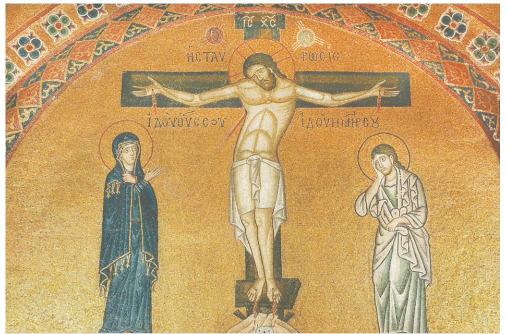
Мозаика Распятия Христова. Монастырь святого Луки (Осиос Лукас), Греция

Страстная среда, утро – читается отрывок о событиях, происшедших в среду утром в Иерусалимском храме, когда ко Христу приводят некоторых из языч-