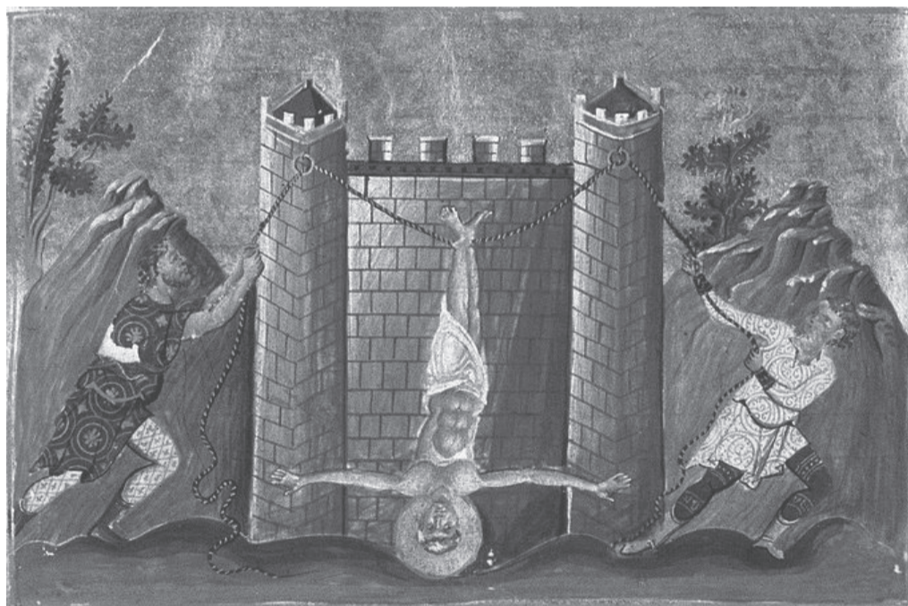
Миниатюра Минология Василия II. Константинополь. 985 г. Ватиканская библиотека. Рим

Впоследствии Филипп был причтен Господом к лику двенадцати избранных апостолов, получил благодать от Него и удостоен был близкого с Ним общения. Однажды в праздник собрались в Иерусалим некоторые из эллинов и не могли приблизиться к Иисусу, будучи неверующими язычниками; поэтому, приступив к Филиппу, просили его, да увидят Иисуса. «Из пришедших на поклонение в праздник были некоторые эллины. Они подошли к Филиппу, который был из Вифсаиды Галилейской, и просили его, говоря: господин! нам хочется видеть Иисуса. Филипп идет и говорит о том Андрею: и потом Андрей и Филипп рассказывают о том Иисусу. Иисус же сказал им в ответ: пришел час прославиться Сыну Человеческому. Истинно, истинно говорю вам: если пшеничное зерно, пав в землю, не умрет, то останется одно: а если умрет, то принесет много плода. Любящий душу свою погубит ее; а ненавидящий душу свою в мире сем сохранит ее в жизнь вечную» (Ин. 12: 20–25). Этим Христос как бы так говорил: «Пока Я живу на земле, то имею только часть дома Израильского, верующего в Меня; если же умру, то не один только дом Израилев, но и многие язычники уверуют в Меня».