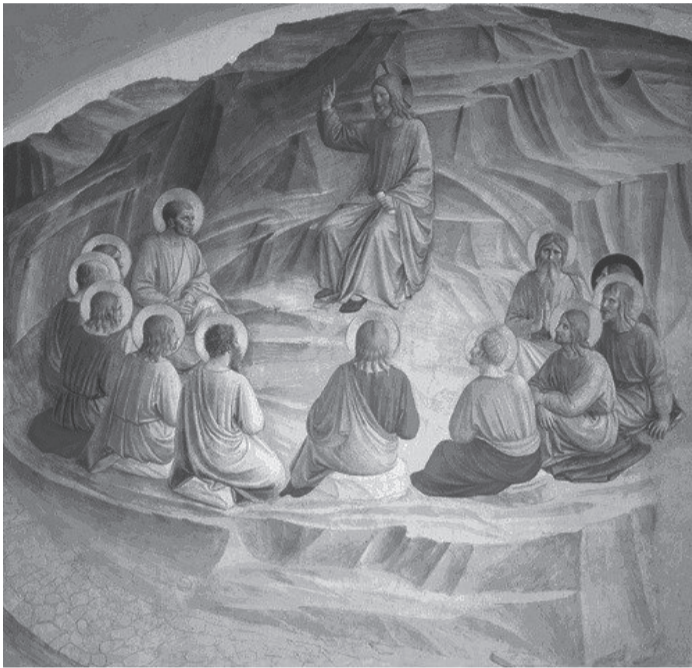
Фреска. Монастырь Сан Марко. Флоренция. Христос и двенадцать апостолов

1 Созвав же двенадцать, дал силу и власть над всеми бесами и врачевать от болезней, 2 и послал их проповедывать Царствие Божие и исцелять больных. 3 И сказал им: ничего не берите на дорогу: ни посоха, ни сумы, ни хлеба, ни серебра, и не имейте по две одежды; 4 и в какой дом войдете, там оставайтесь и оттуда отправляйтесь в путь. 5 А если где не примут вас, то, выходя из того города, отрясите и прах от ног ваших во свидетельство на них. 6 Они пошли и проходили по селениям, благовествуя и исцеляя повсюду.