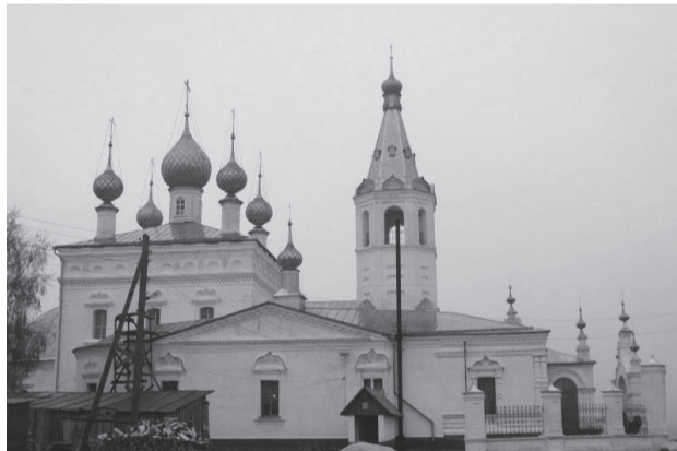
Храм святителя Иоанна Златоуста в селе Годеново

С той поры как течет живительная родниковая вода, так полились чудеса и исцеления на этом святом месте. Всем просящим подавал Господь от Креста помощь: хромым хождение, слепым прозрение, недужным здравие. И было заведено священнослужителями записывать все происходящие чудеса в специальную книгу. Отметим, что первая такая книга сгорела при пожаре, который случился в храме, но спустя время запись чудотворений была возобновлена.