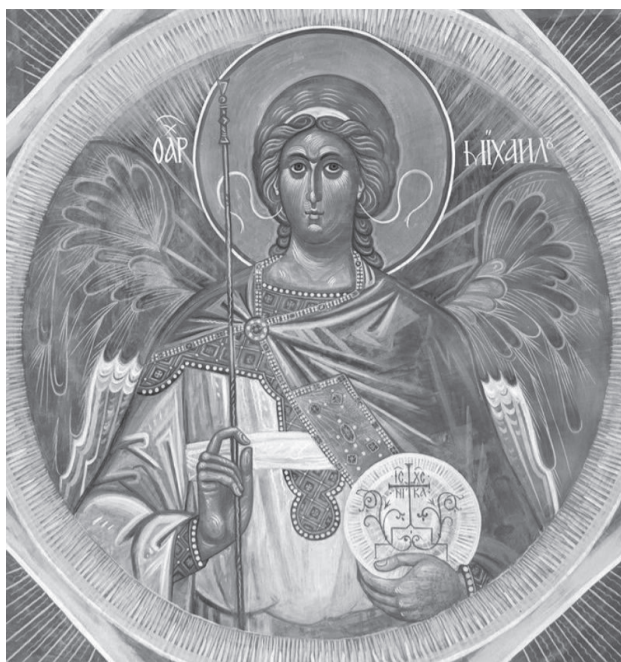
Архистратиг Михаил Никольская церковь в Наро-Фоминске.

Премудрость Божия учредила удивительный по-