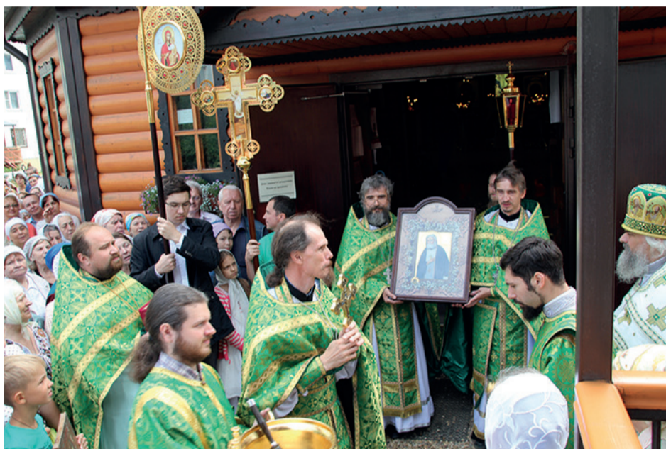
Фото с престольного праздника 1 августа 2015г.