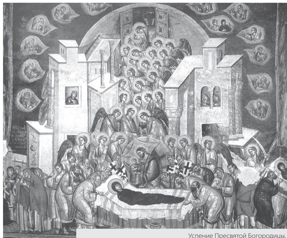
Успение Пресвятой Богородицы. Охрид (Македония). Церковь Богоматери Перивлепты. 1294 - 1295 гг.