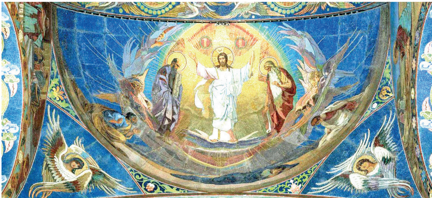
Преображение Господне. Храм Спаса на Крови, Санкт-Петербург. Мозаика

Газета прихода Серафимовского храма, г.Королев Московской области