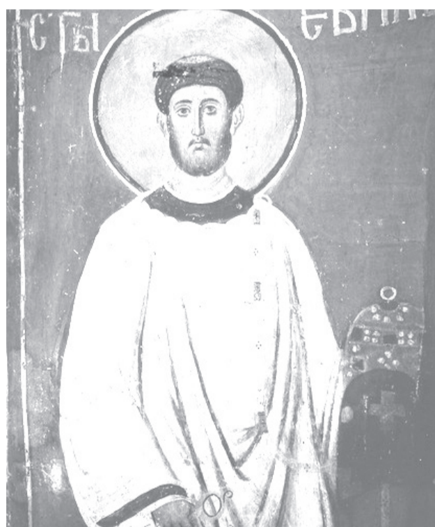
Святой мученик Архидиакон Евпл. Фреска церкви Богородицы в монастыре Студеница, Сербия. 1208 - 1209 годы.