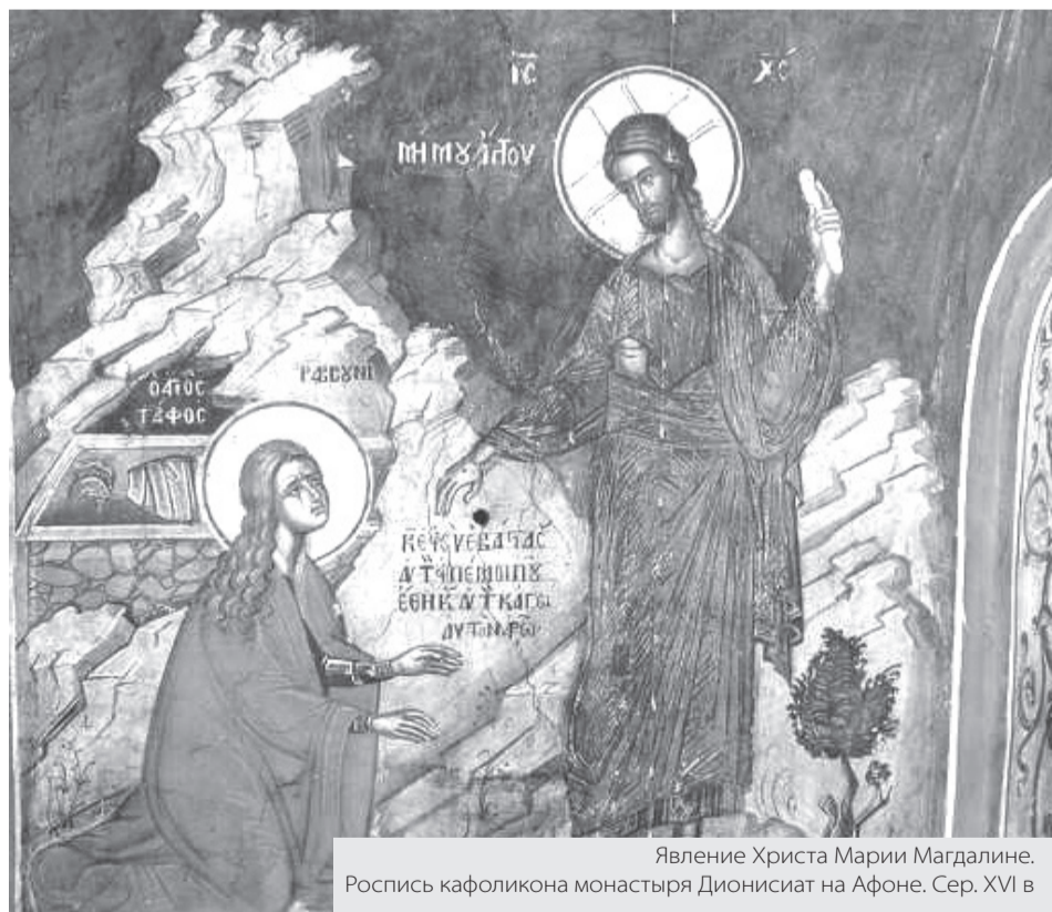
Явление Христа Марии Магдалине. Роспись кафоликона монастыря Дионисиат на Афоне. Сер. XVI в

4 АВГУСТА – ДЕНЬ ПАМЯТИ МИРОНОСИЦЫ РАВНОАПОСТОЛЬНОЙ МАРИИ МАГДАЛИНЫ (I в.)